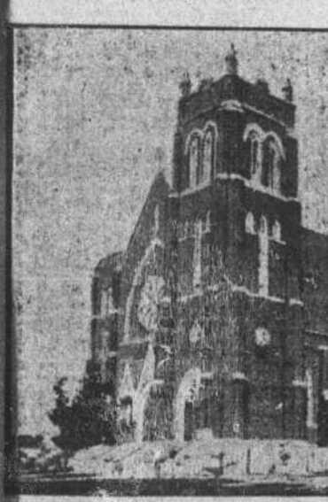
L'Église de la paroisse de l'Immaculée Conception, à Windsor, Ont.

qui savaient qu'en 1853, plus de 20,000 de nos compatriotes, fermement attachés à leur religion et à la langue des ancêtres, s'étaient solennellement implantés dans les comtés d'Essex et de Kent, où ils forment aujourd'hui une masse prépondérante de 20,000 unités. M. Rambeau les avaient découverts lors de son premier voyage au Canada, mais combien encore, de nos jours, dans la province de Québec, ignorent que le point extrême du Canada, celle qui s'enfonce en pleine terre américaine, est peuplée de Canadiens-français.