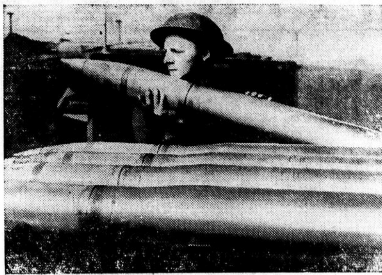
Les artilleurs de la D. C. A. qui protègent les Iles britanniques abattent un nombre toujours croissant de raiders nocturnes allemands. Sur cette photo, un artilleur soulève un obus de 4.5 pouces.

Après le froid intense que nous avons eu, la glace est si bien prise que nous pouvons circuler facilement du côté opposé. Le chemin étant fermé, cela permet aux habitants de cette petite île, de s'approvisionner pour le reste de