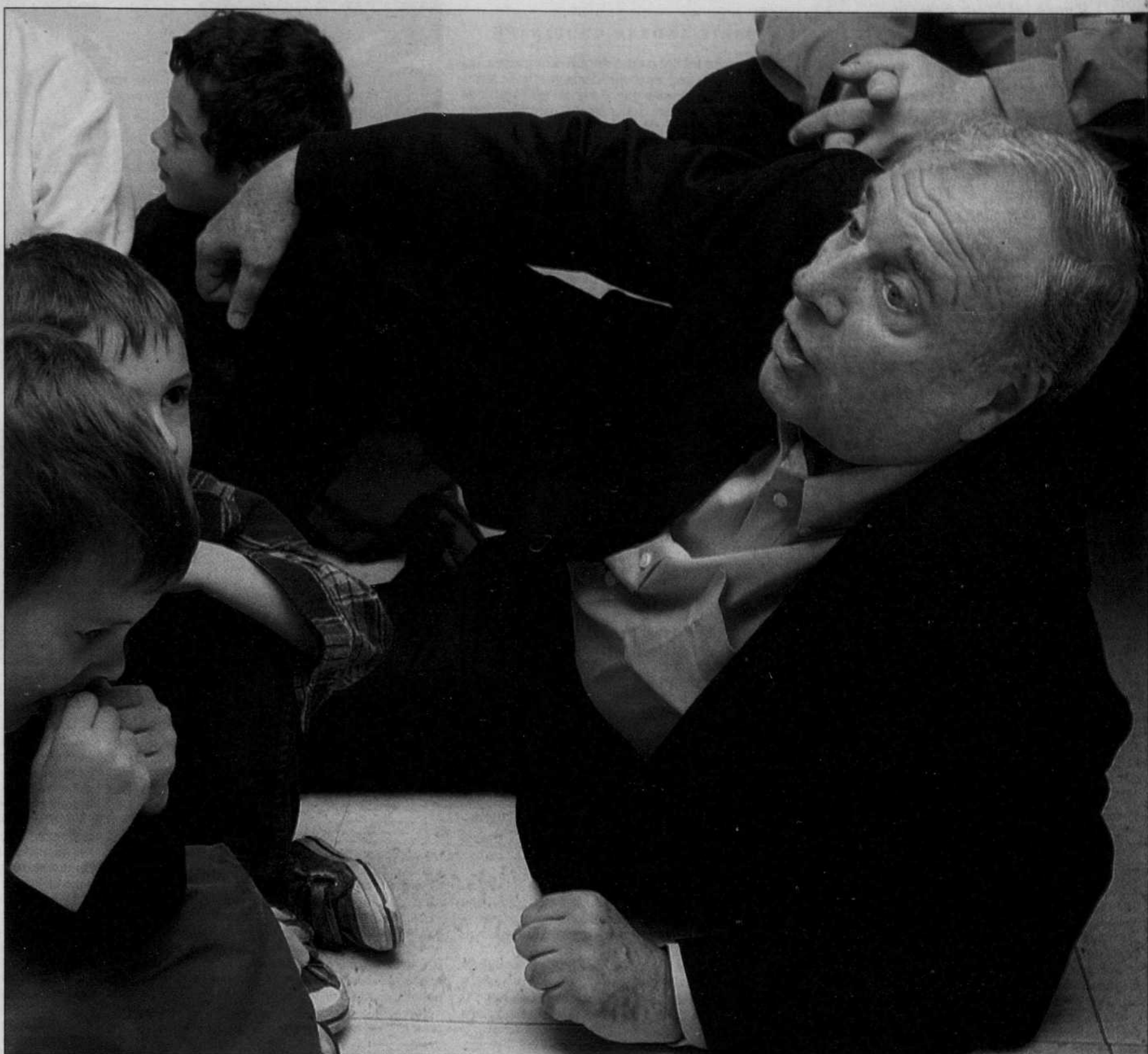
Journée décontractée pour Paul Martin hier, dans une garderie de Dartmouth, en Nouvelle-Écosse.