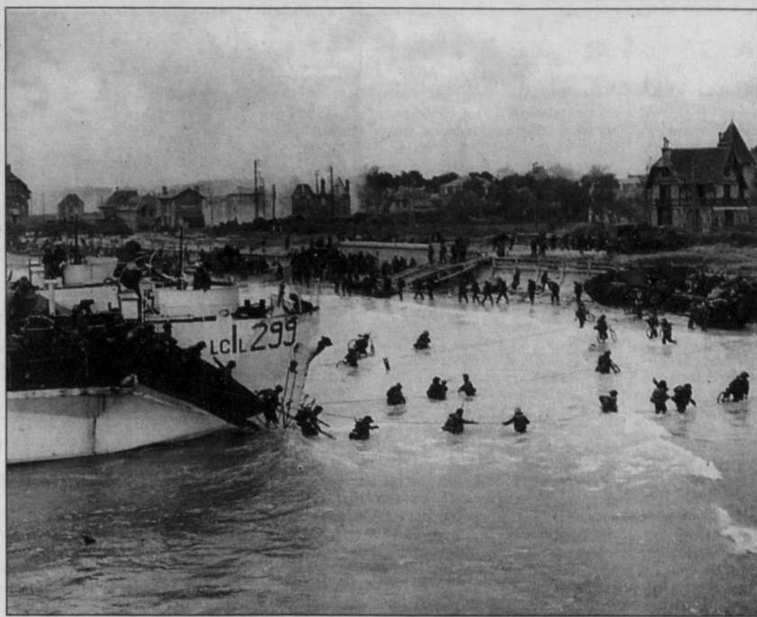
Sur la plage «Nan White», la 9 e brigade d'infanterie canadienne débarque de la péniche de débarquement 299 de la Marine royale canadienne au jour J, à Bernières-sur-Mer.

À l'instar d'autres journalistes, les correspondants