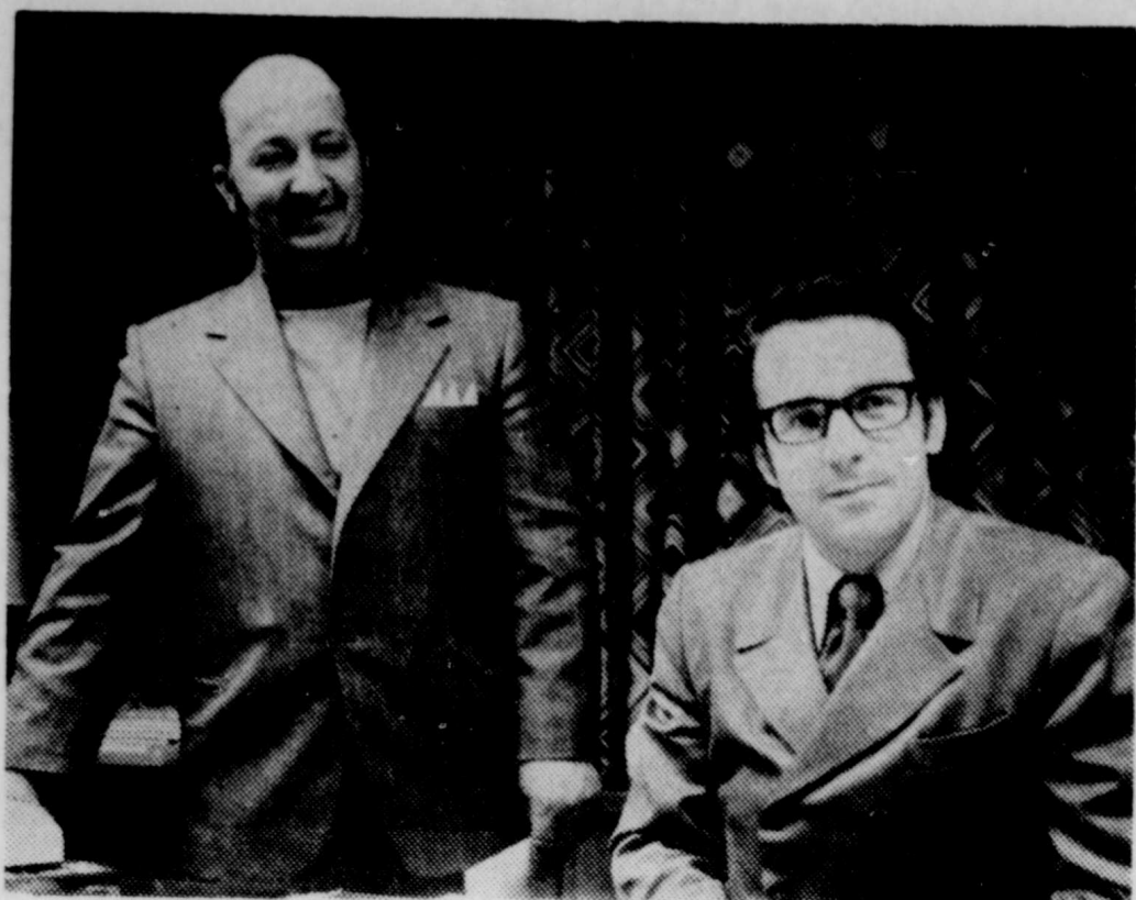
La ligue de balle-molle Commerciale Labatt 50 de Victoriaville, démarre sur un bon pied et est appelée à connaître de bons succès cet été. Les dirigeants de ce circuit se sont réunis cette semaine à la