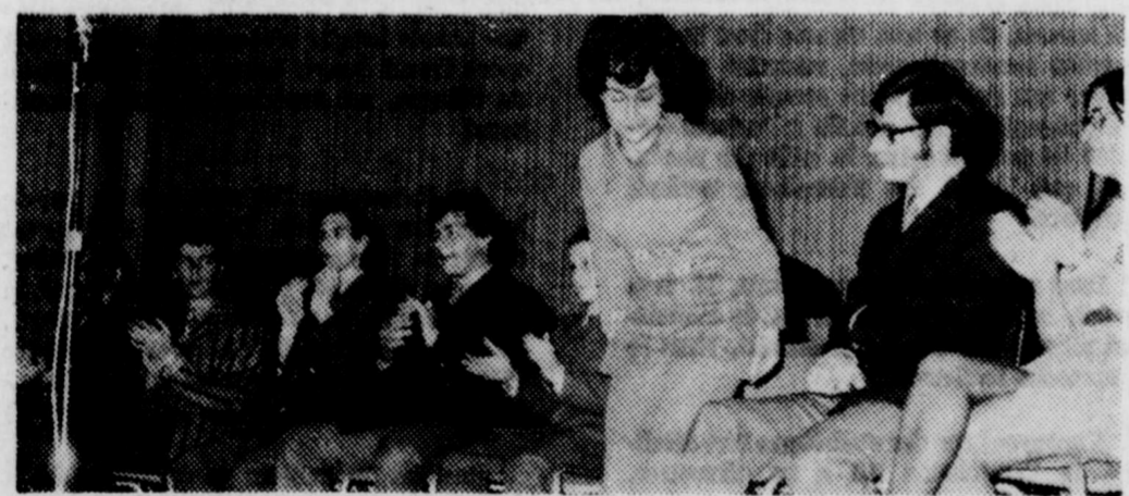
De nombreux étudiants ont fait valoir leur talent d'orateur également au cours de cette exposition. Ce concours a été des plus appréciés. Il fallait voir le nom-

la population, il est fort possible que la manifestation prenne encore plus d'ampleur dès la prochaine année. Quelques personnes admirent ici des travaux manuels.