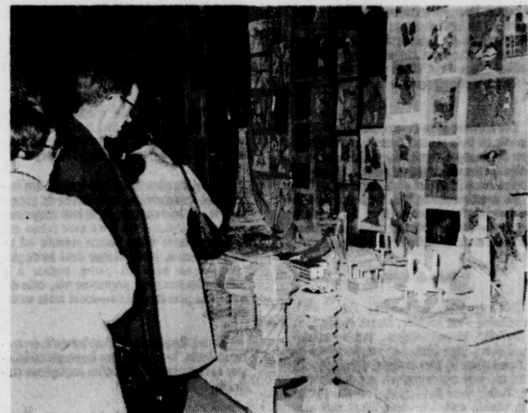
Des centaines de personnes se sont rendues au Collège St-Bernard de Drummondville, en fin de semaine, pour visiter la grande exposition de travaux d'étudiants. Devant l'intérêt manifesté par

la population, il est fort possible que la manifestation prenne encore plus d'ampleur dès la prochaine année. Quelques personnes admirent ici des travaux manuels.