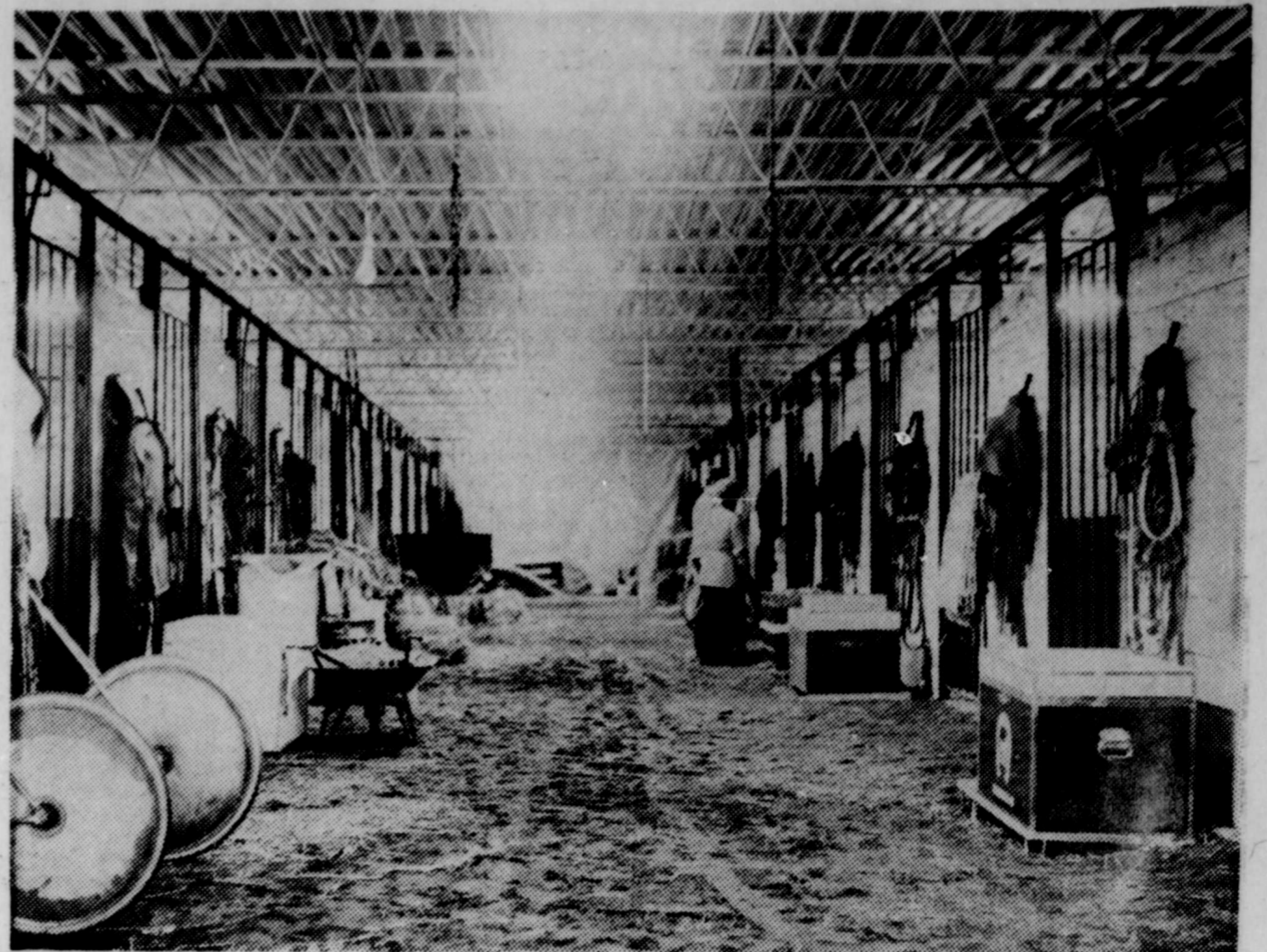
Une vue des nouvelles écuries