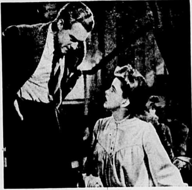
Van Heflin et Judy Garland dans une scène de la production "Presenting Lily Mars", grand film au programme du théâtre Palace cette semaine.