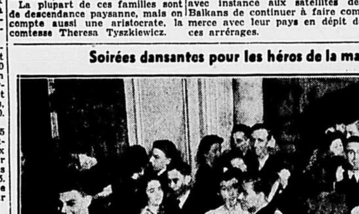
On organise régulièrement des soirées dansantes pour distraire les 'silencieux' héros de la marine marchande...