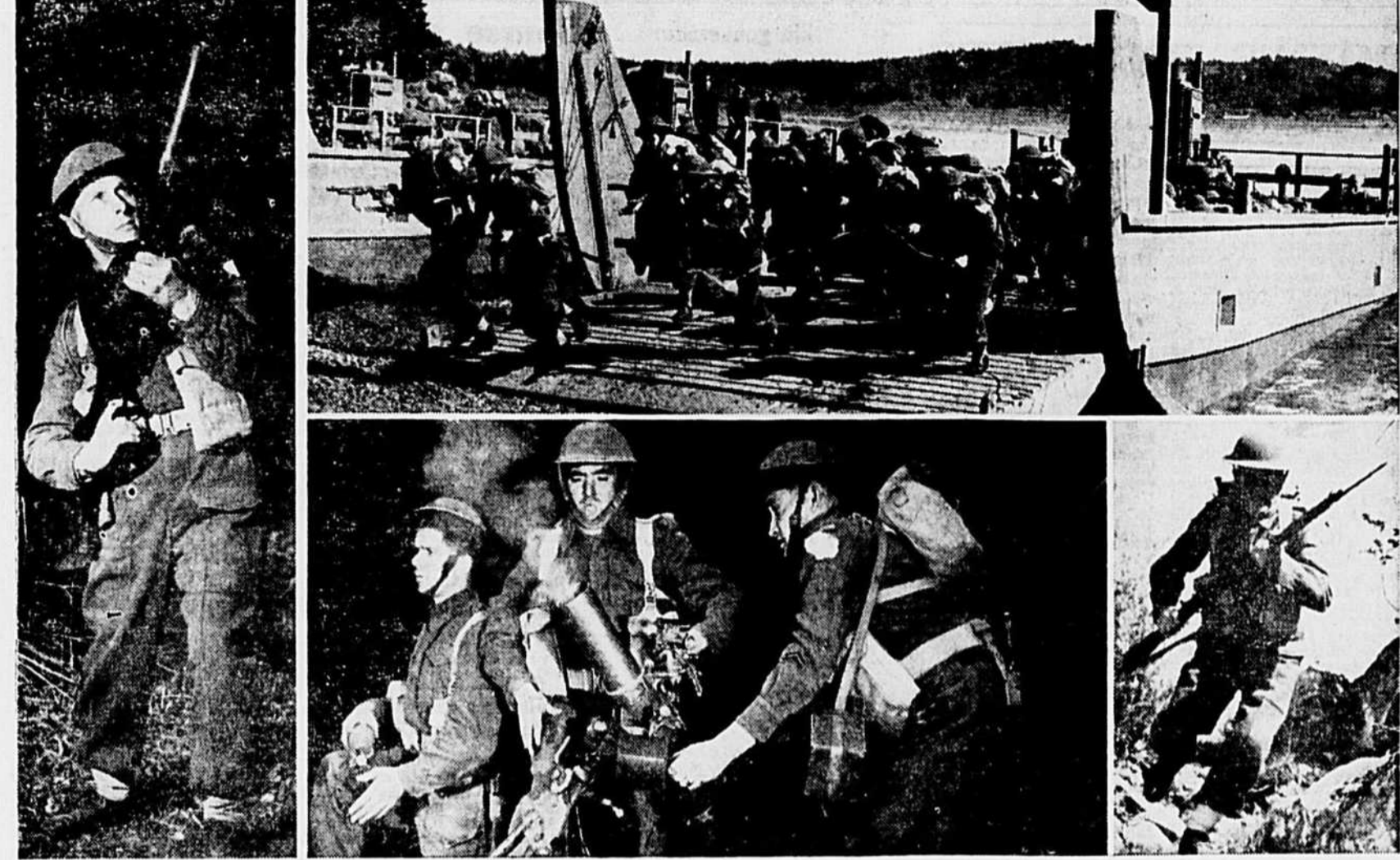
Le Régiment de Hull se livre actuellement à un entraînement intense "quelque part au Canada". Les membres du seul régiment canadien-français du district militaire no 3 s'entraînent aux tactiques d'invasion en vue du grand jour. Armés de pied en cap, quelques membres de cette unité (photo du haut), bondissent de la berge d'invasion et s'apprêtent à établir leur position sur le rivage. A gauche, un expert de la mitrailleuse Bren s'est installé pour faire feu contre les forces aériennes pendant que les détachements de mortier (au centre en bas) contribuent à solidifier leur position. Une fois bien retranchés, les troupes peuvent se lancer à l'attaque de l'ennemi ainsi qu'en témoigne la photo du bas, à droite. Bien que les prises au Canada, ces photographies donnent une excellente idée des méthodes d'invasion qui seront utilisées quand sonnera l'heure "H". Le mitrailleur est le soldat L. Favreau, tandis que le groupe du centre se compose des soldats B. Bernard, L.-P. Fortin et L. Courcy. A droite, le soldat C.-E. Boucher.