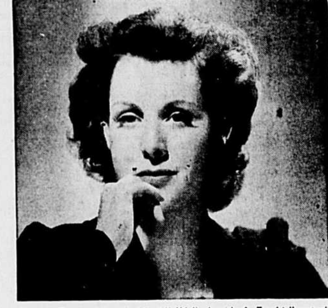
Frances Dee, vedette du film "I Walked with a Zombie" actuellement au programme du théâtre Princess, en programme double avec The Leopard Man.