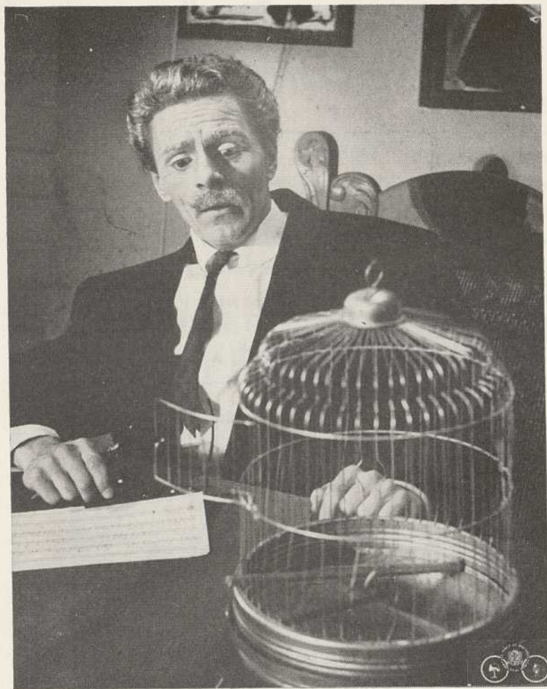
CLAUDE LÉVEILLÉE dans le rôle de Chabert