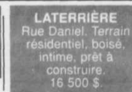
Alain Maltais 690-2900

LA BAIÉ: 3043, Wilfrid-Simard. Magnifique maison tout brique, tout rénovée de 3 chambres, poss. de 4) avec salle familiale et salon avec foyer. Grand patio sur l'air d'auto et terrasse arrière. Vue splendide sur le Saguenay. Possibilité d'un logement au sous-sol.