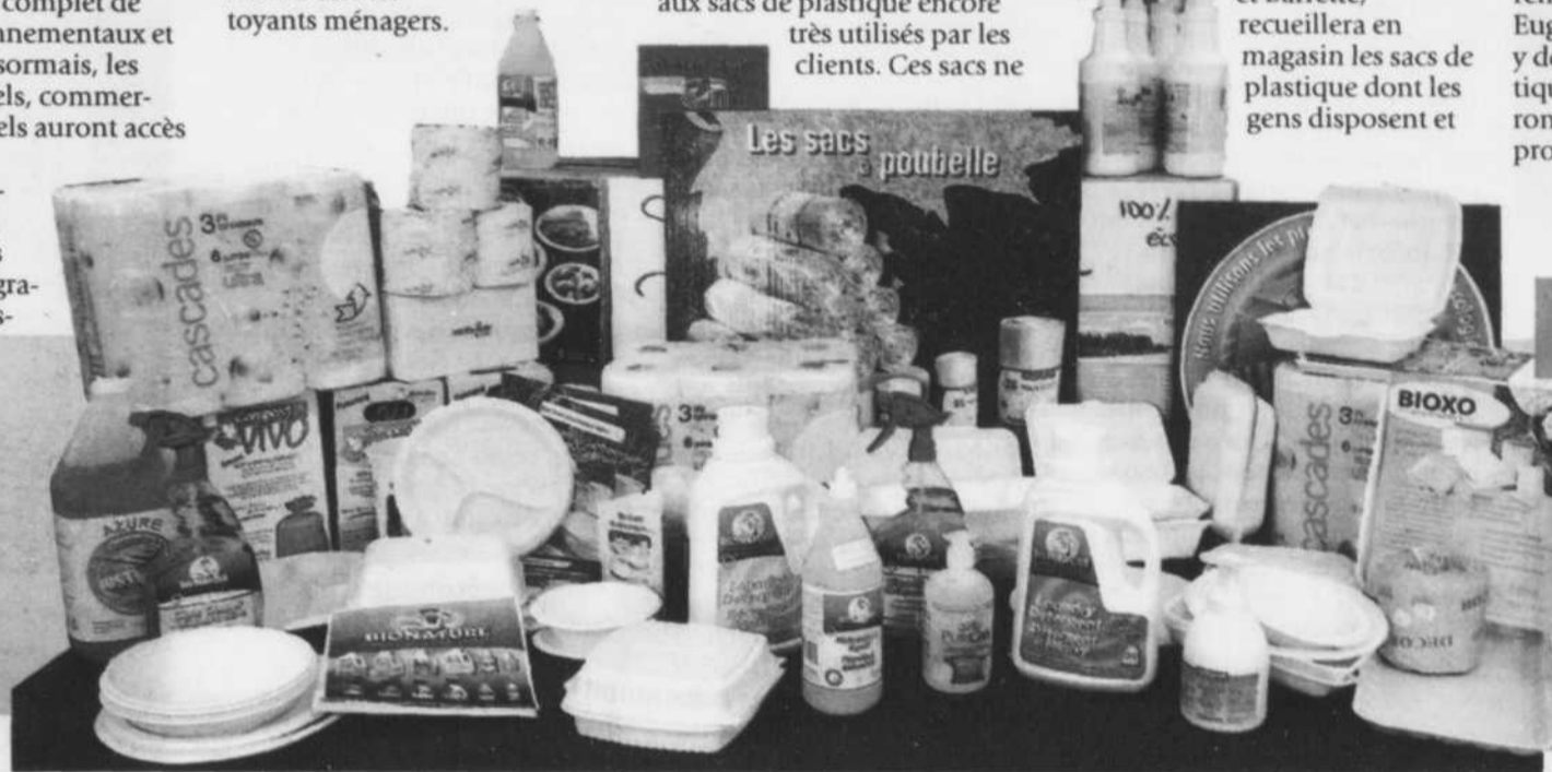
L'entreprise Eugène Allard offre à ses clients un département complet de produits environnementaux et écologiques.

qui ne sont pas biodégradables. L'entreprise va elle-même acheminer les sacs vers un centre de recyclage. Après tout, tout le monde doit contribuer pour protéger l'environnement. Les gens seront donc invités à se rendre au magasin Entrepôt Eugène Allard libre-service pour y déposer leurs sacs de plastique. En même temps, ils pourront jeter un coup d'œil aux produits écologiques.