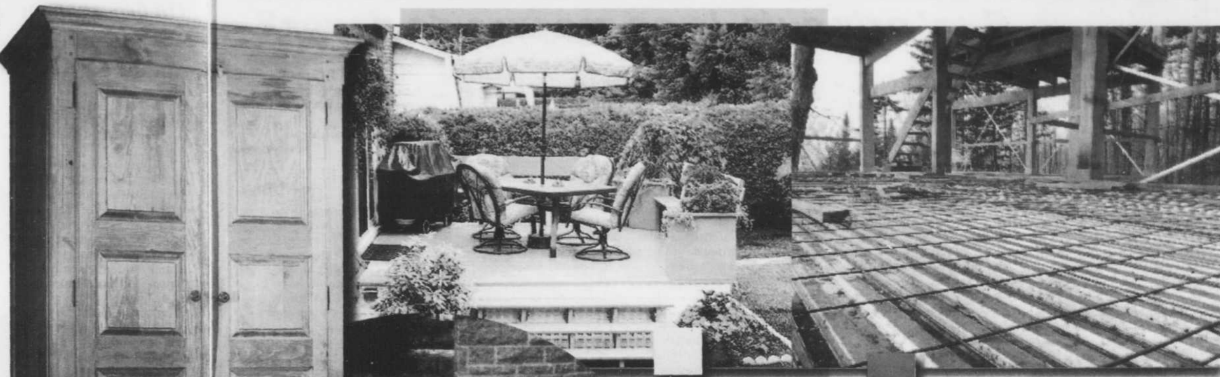
EXTÉRIEUR - Pour les patios et balcons, on peut utiliser les planches de plastique recyclé Perma-Deck, de la compagnie Cascades Re-Plast. Durables et faciles d'entretien, elles nous évitent la corvée de peinture.

Pour recouvrir les planchers, on préfère le bois récupéré ou certifié FSC. Dans la cuisine, la céramique, l'ardoise ou le linoléum fabriqués localement sont à privilégier. Pour les patios et balcons, on peut utiliser les planches de plastique recyclé Perma-Deck, de la compagnie Cascades Re-Plast. Durables et faciles d'entretien, elles nous évitent la corvée de peinture. Cascades Re-Plast fabrique aussi du mobilier urbain tel que bancs de parc, tables de pique-nique, bacs à fleurs et seuils de porte.