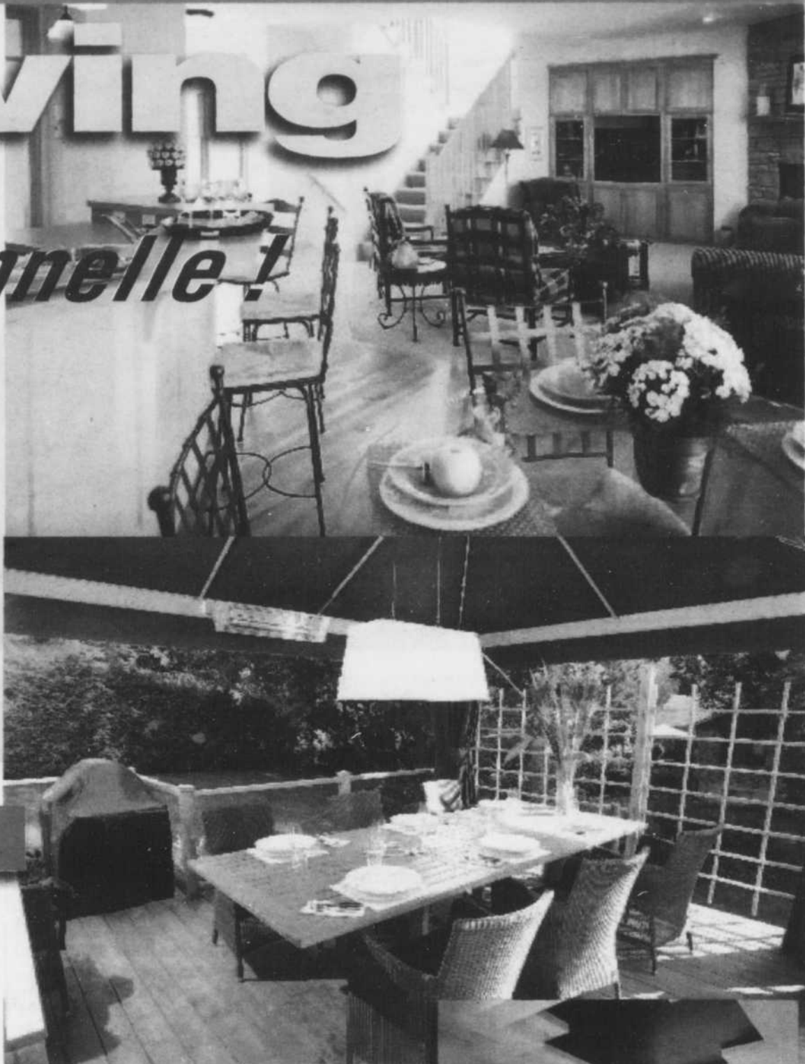
DIMENSION - Les architectes repensent leurs plans en agrandissant le volume des pièces à vivre.

Dernière tendance en date, le hiving (de l'anglais «hive», «ruche») remplace ou renouvelle le nesting. La maison joue toujours un rôle prépondérant: elle est même au (ou le) centre d'activités regroupant la famille ou les proches (amis, voisins, collègues). Lieu de divertissement, de réception et de travail, le foyer est sans cesse animé et toujours ouvert sur l'extérieur. Chacun «fait comme chez lui», apporte sa participation comme une abeille son butin. Ce style de vie collectif, presque communautaire, pousse d'ailleurs les architectes à repenser leurs plans: les volumes des salles d'eau et chambres sont diminués afin d'agrandir les pièces à vivre, et le dehors (balcon, terrasse, jardin) aménagé. Bienvenue dans une aire multifonctionnelle!