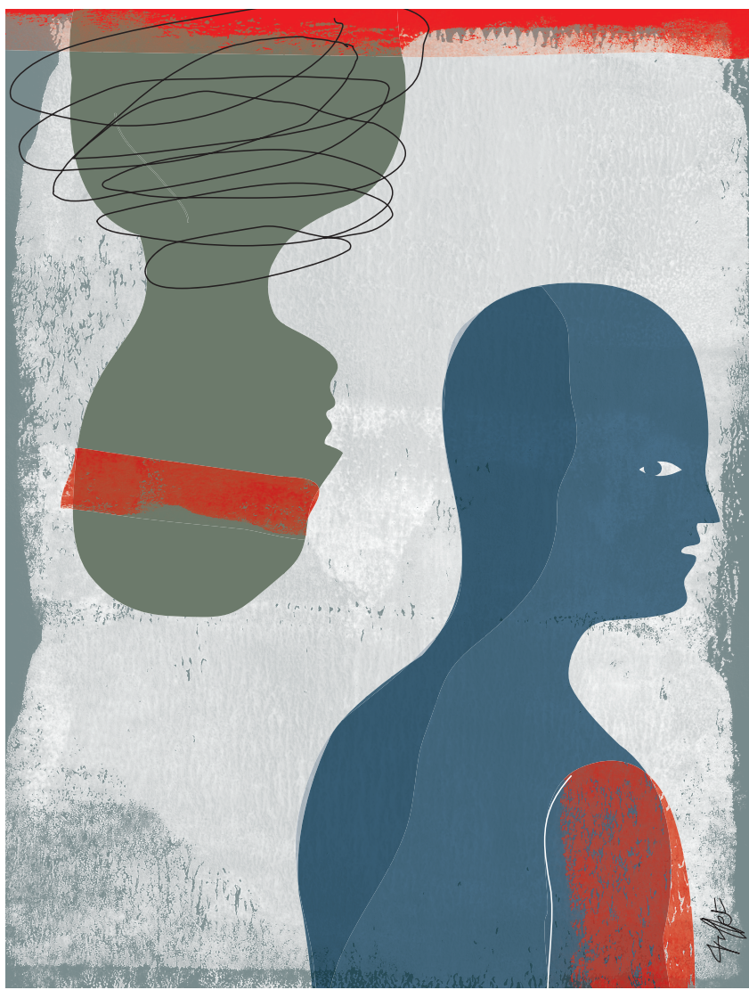
ILLUSTRATION CHRISTIAN TIFFET

Nous pourrions interpréter la lettre de Vic Toews comme une autorisation à la pratique de la torture par des agents ou des militaires canadiens, mais ce serait un mensonge. Cela n'excuse en rien notre