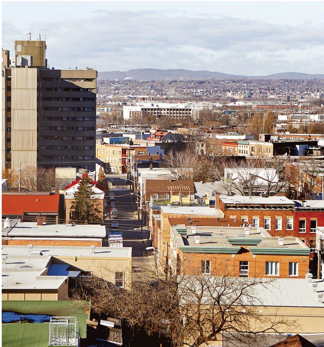
VAN DOUBLET LE DEVOIR

La conseillère de district a convaincu le promoteur de l'îlot Irving qu'en incluant des logements sociaux et des éléments verts, son immeuble se ferait mieux accepter.