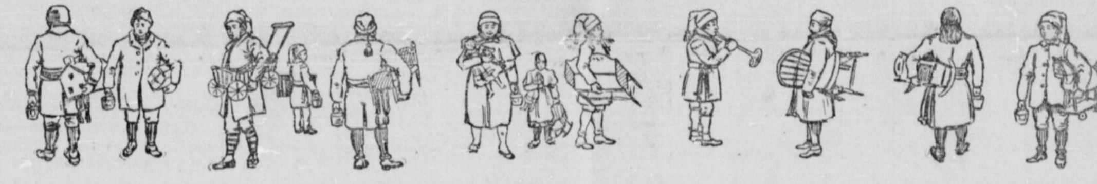
LA FETE DES ENFANTS—Défilé des petits enfants après la distribution des jouets.