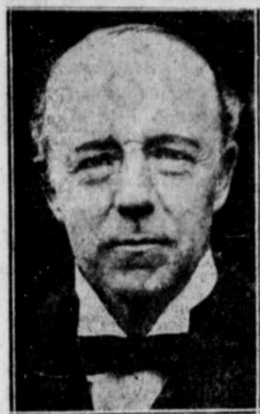
Le T. H. Walter RUNCIMAN, l'un des délégués de la Grande-Bretagne à la conférence impériale d'Ottawa, le mois prochain. C'est un armateur renommé du Royaume-Uni.