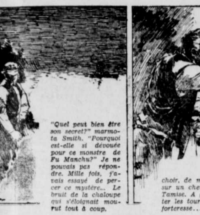
Quel peut bien être son secret? "Pourquoi est-elle si dévouée pour ce monstre de Fu Manchu? Je ne pourrais pas répondre. Mille fois, j'ai essayé de pénétrer ce mystère. Le bruit de la chaloupe qui s'éloignait moutait tout à coup.