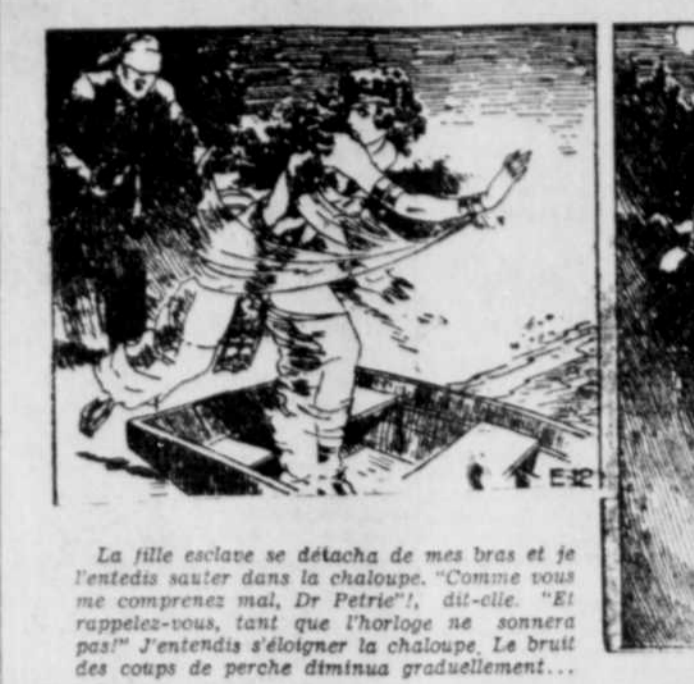
La fille esclave se détacha de mes bras et je l'entendis sauter dans la chaloupe. "Comme vous me comprenez mal, Dr Petrie", dit-elle. "Et rappelez-vous, tant que l'horloge ne sonnera pas" J'entendis s'éloigner la chaloupe. Le bruit des coups de perche diminua graduellement...