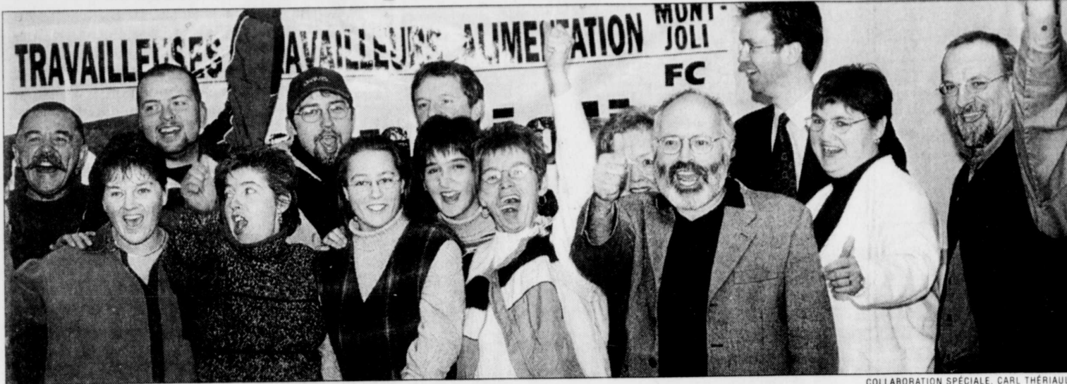
Après 18 mois de grève, plus de 80% des employés ont entériné l'accord de principe.

Loblaw vaincue par les travailleurs de Mont-Joli