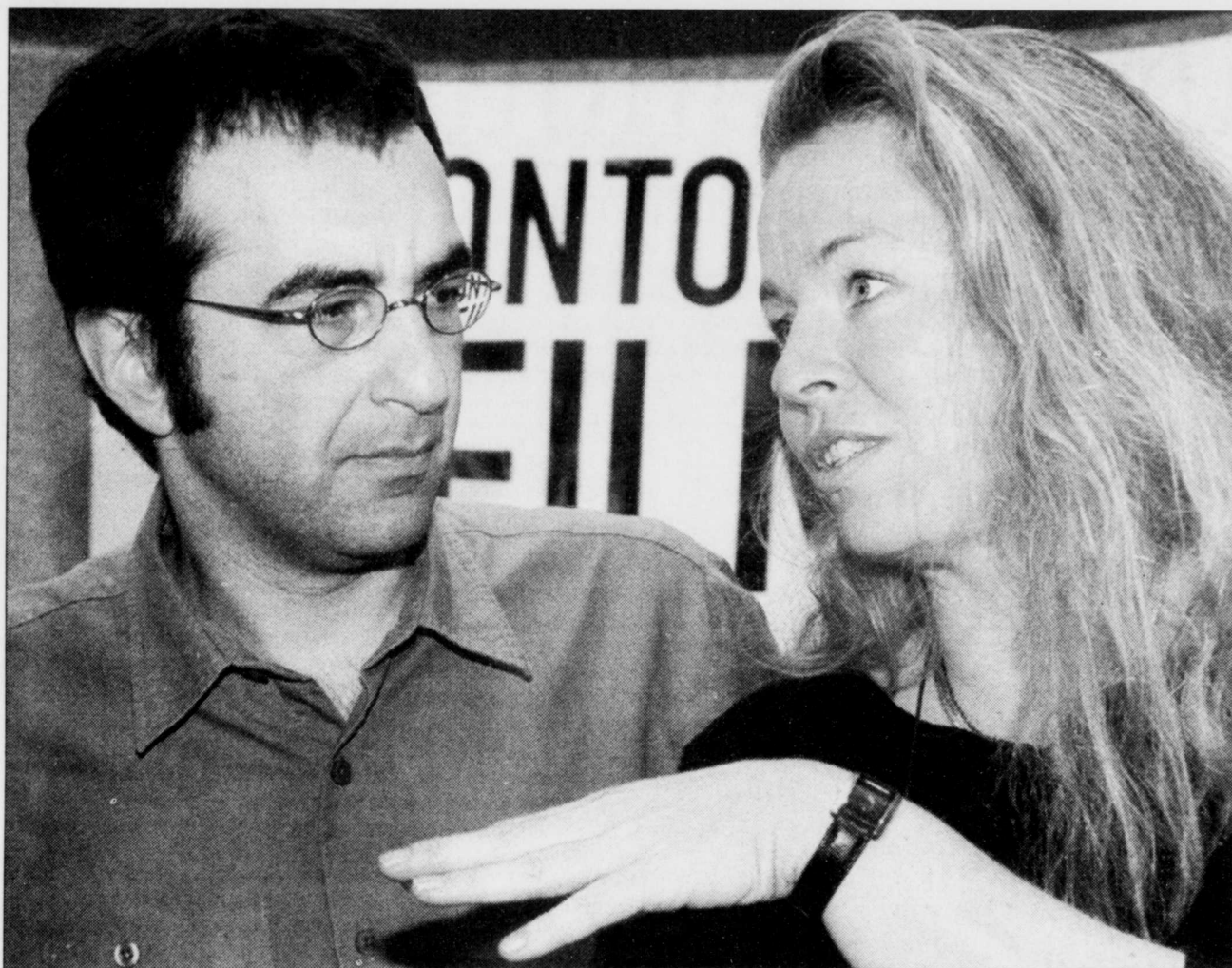
La cinéaste Patricia Rozema et le réalisateur Atom Egoyan, lors du récent festival de Toronto.