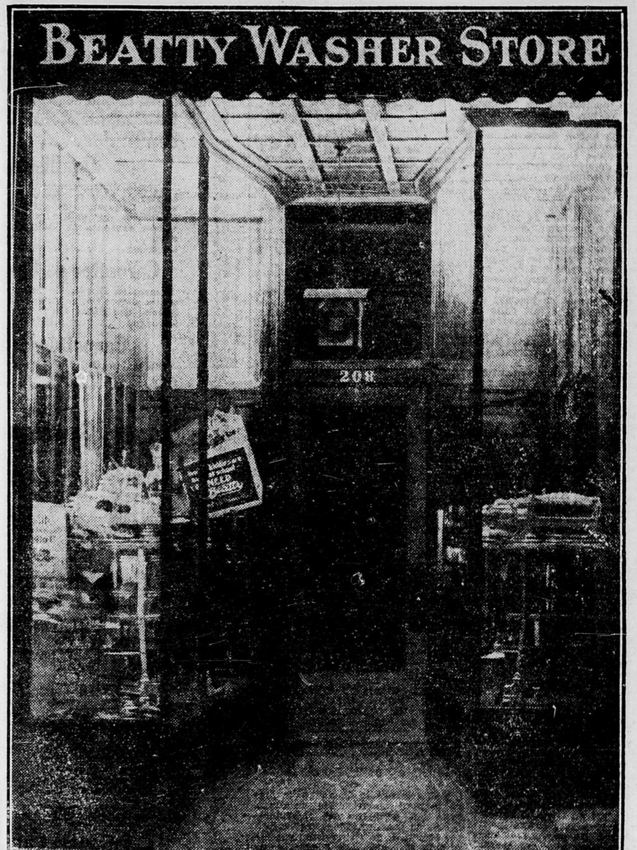
Nouveau magasin de Machines à Laver Beatty, au No 208, rue Sparks.

Donnez une Machine à Laver pour Noël! Votre épouse ou votre mère ne saurait apprécier rien de plus qu'une Machine à Laver Beatty.