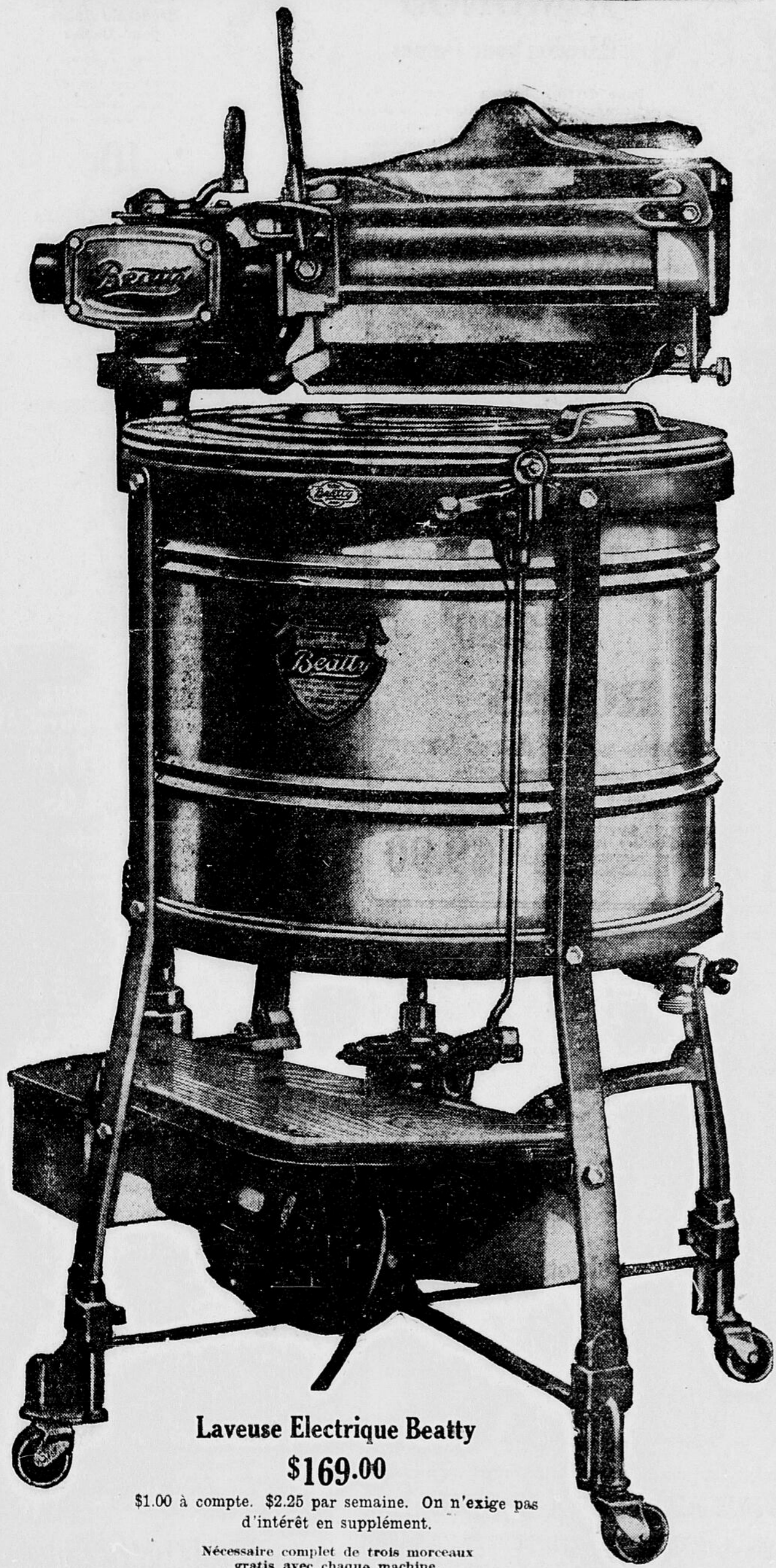
Laveuse Electric Beatty $169.00

$1.00 à compte. $2.25 par semaine. On n'exige pas d'intérêt en supplément.