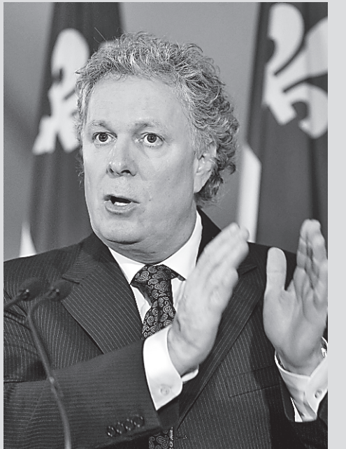
Jean Charest a promis que le Québec ne retournerait pas en déficit.

Heureusement pour le Québec, Jean Charest a souvent la chance de recevoir un chèque-cadeau du gouvernement fédéral.