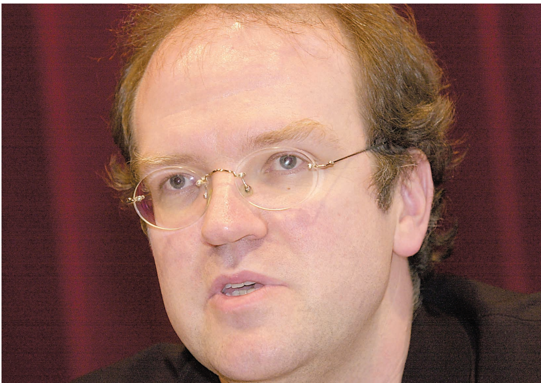
Bernard Labadie, le nouveau directeur artistique de l'Opéra de Montréal, en conférence de presse hier après-midi.

PROJE(C)T Y est actuellement en pleine tournée québécoise. Pour une sixième année, les meilleurs courts métrages universitaires québécois se voient offrir une tribune. Le Cinéma Parallèle participe à cette aventure pour une troisième année en accueillant le festival les 12, 13 et 14 avril, pour la clôture de sa tournée, à Montréal. Cette année, Proje(c)t Y innove en présentant un volet documentaire le samedi 13 avril et le dimanche 14. Au départ simple soirée de projection, le Proje(c)t Y est désormais un festival itinérant dont l'action couvre à peu près l'ensemble des régions du Québec. De Val-d'Or à New-Richmond, de Sherbrooke à Chicoutimi et de Québec et Montréal, Proje(c)t Y a comme objectif de présenter à un plus grand public les créations cinématographiques étudiantes.