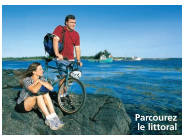
Parcourez le littoral