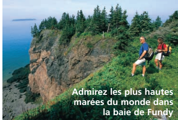
Admirez les plus hautes marées du monde dans la baie de Fundy