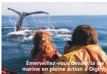
Émerveillez-vous devant la vie marine en pleine action à Digby

Vous dégusterez les fruits de mer frais les plus délicieux de votre vie, apprêtés selon des recettes originales qui raviront tous les palais.