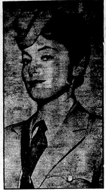
Les soldats du fort MacArthur viennent d'exprimer une opinion qui aura probablement une grande influence sur la mode des uniformes féminins des services de l'armée. Ils prétendent, en effet, que les femmes qui font partie de corps spéciaux perdent tout leur charme lorsqu'elles sont en uniforme. A preuve, Olivia de Havilland, à gauche, délicieusement féminine en tenue civile, et son apparence «garçonnière» en uniforme à droite.