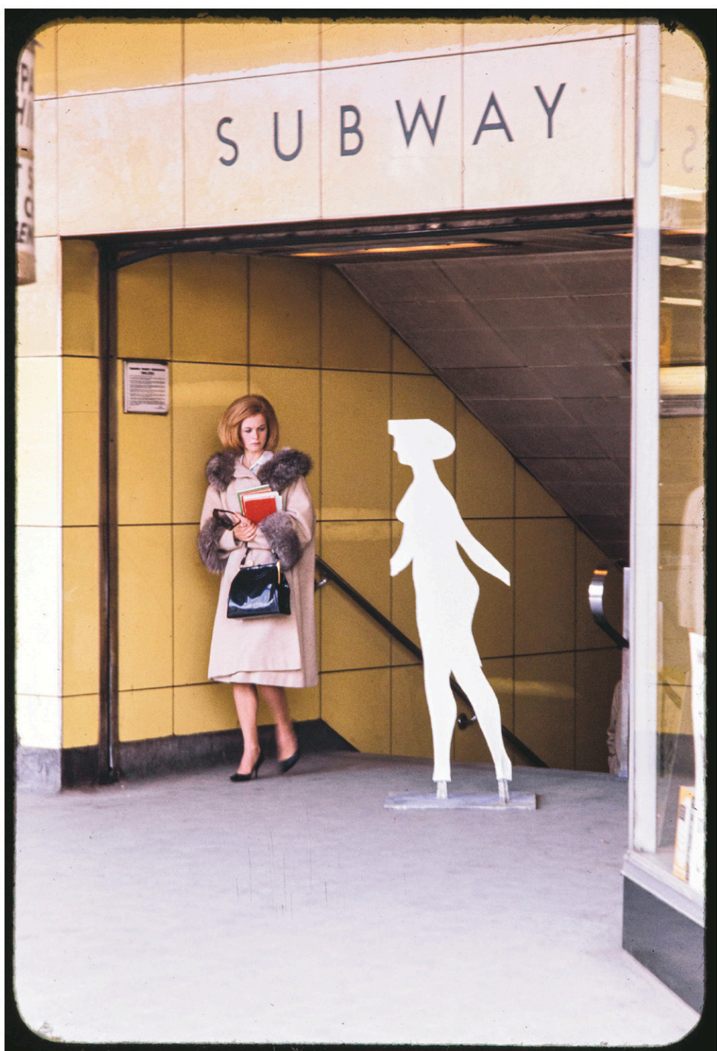
Michael Snow, Walking Woman in Toronto Subway , 1963-2016