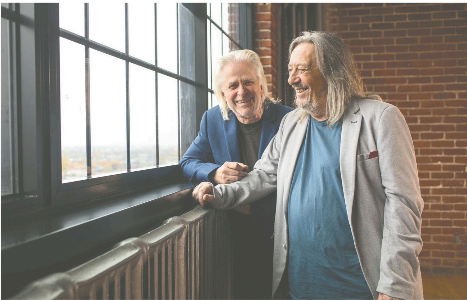
Louis Valois et Serge Fiori, du groupe Harmonium, ont replongé dans l'album-phare L'Heptade .