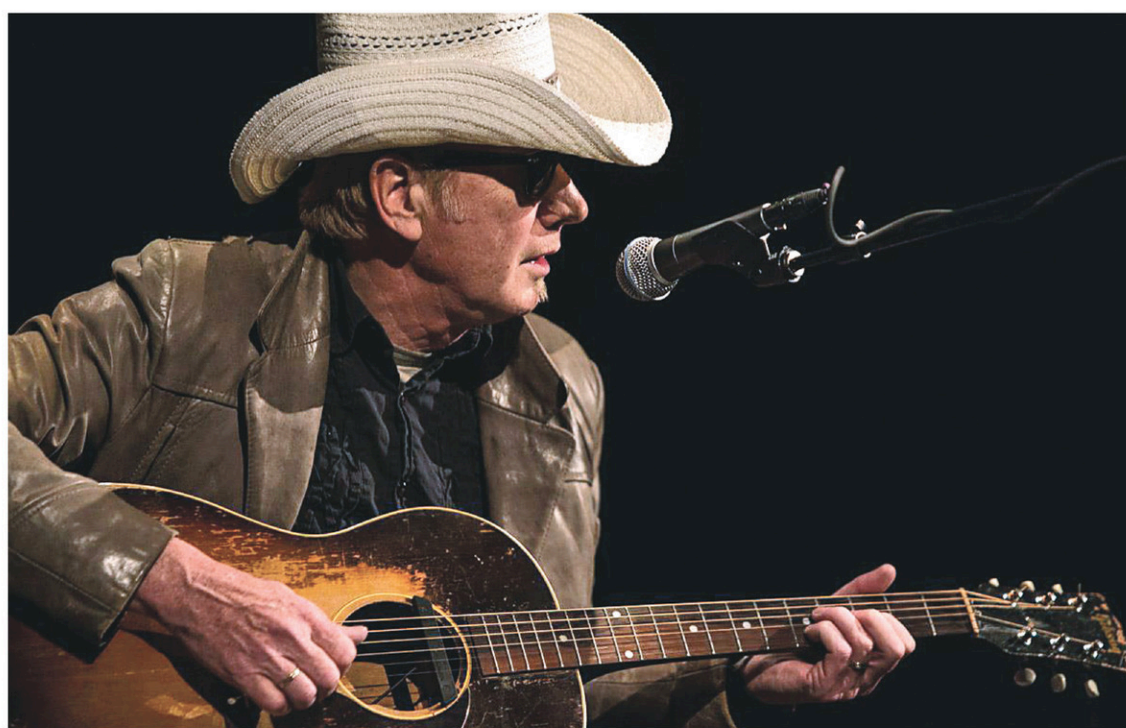
Bo Ramsey est un chanteur à la voix effilée, celle qui touche en plein dans le mille.