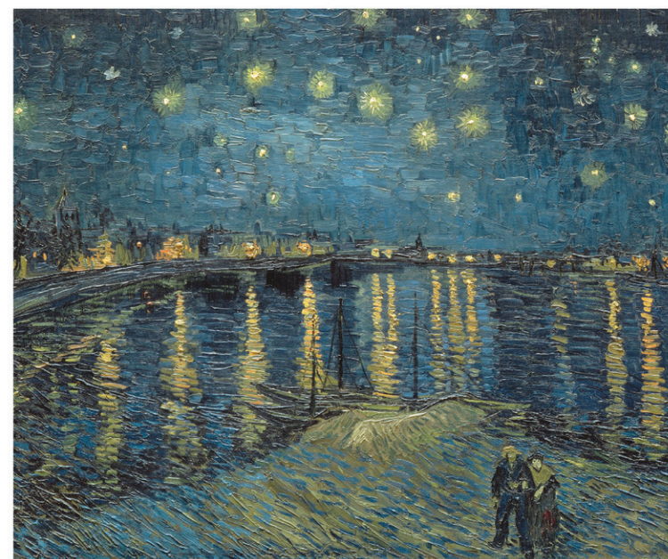
Vincent van Gogh, La nuit étoilée sur le Rhône à Arles , 1888. Tableau présenté à l'exposition Mystical Landscapes .

Ces artistes ont du coup réfléchi sur les identités ethniques, les identités sexuelles... L'art