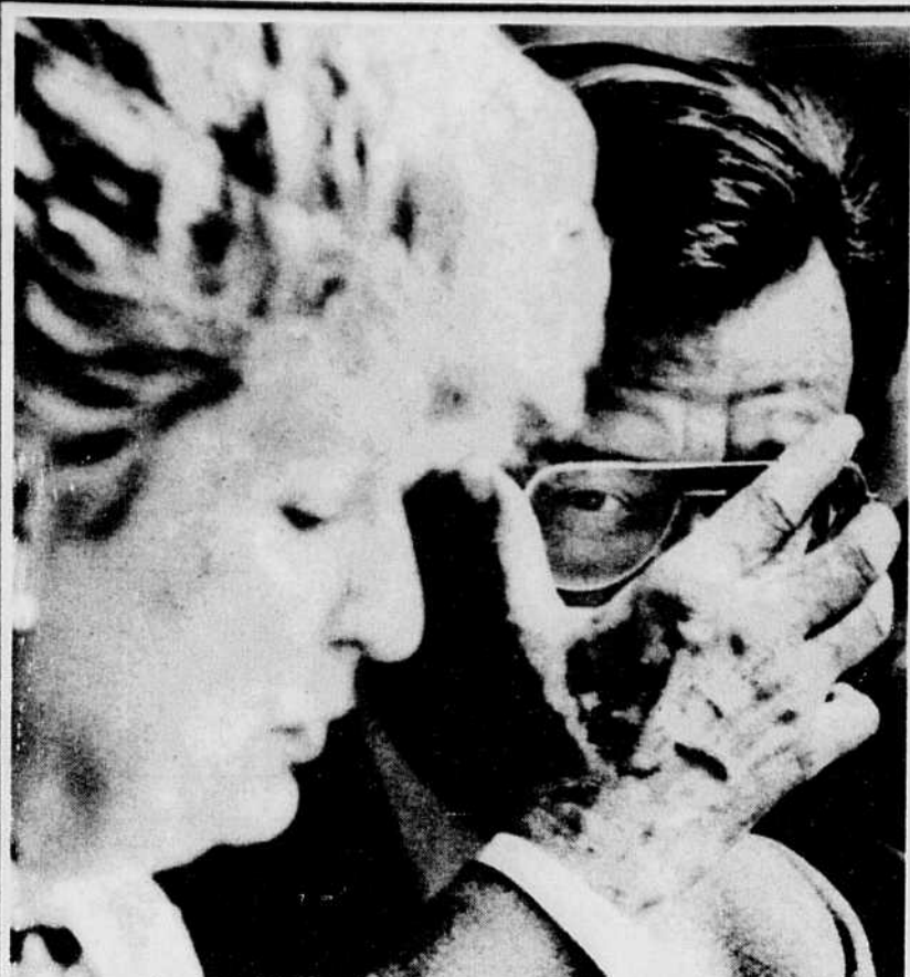
Ajustant ses lunettes, Robert Bourassa semble murmurer en même temps quelques mots à Lise Bacon, lors d'une conférence de presse hier.