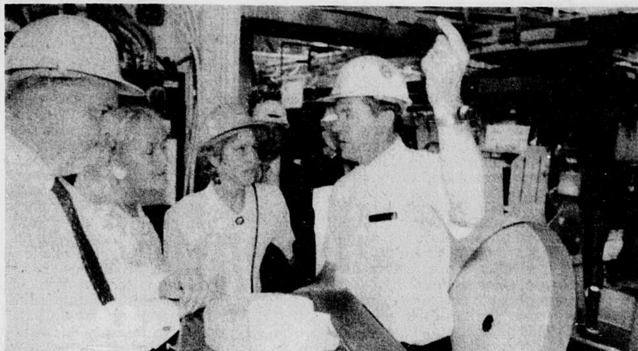
En compagnie de la candidate Pauline Marois, Jacques Parizeau a visité hier le moulin à papier de Kruger à Trois-Rivières.

Lui qui clamait mercredi que cette «grève illégale dans les hôpitaux était inacceptable», semblait disposé hier à qu'elle se poursuive. «Tous les rapports que nous avons indiquent que la grève se déroule de façon très civilisée et dans le calme», a-t-il soutenu. «Quand l'intérêt du public est en cause, a-t-il dit plus tard, il ne faut pas s'accrocher strictement à l'aspect légal de la question.»