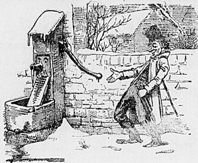
—J'te connais pas; mais ça fait rien—donne-moi la main, vieux