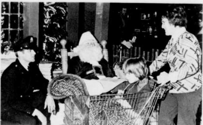
Au cours de la tournée «cadeaux et friandises» des Galeries d'Anjou, un jeune impressionné par le Père Noël et un représentant de l'Association des pompiers de Montréal.