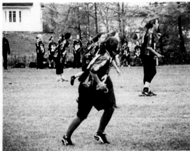
Collège de l'Assomption

Mais la plus grave fut celle qui donna l'occasion à l'autre équipe de faire le toucher de leur victoire. La joueuse de PPA passa avec le ballon en échappé devant l'arbitre et une défense vint la toucher devant les yeux du juge de la partie. Mais il ne broncha même pas, à croire qu'il était aveugle. Elle fit donc le toucher qui les mena à la victoire. Elles ont pour ainsi dire gagné le match des régionaux, la bannière et bien sûr la médaille d'or. Mais entre vous et moi, j'aime beaucoup mieux perdre la tête haute que gagner grâce à un arbitre minable.