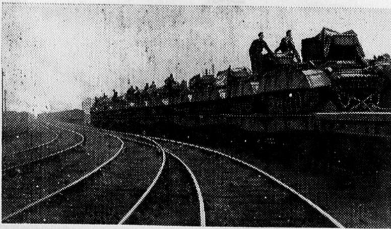
Un convoi de chemin de fer, porteur d'équipement et de fournitures de guerre, en route vers les champs de bataille. Celui-ci transporte des tanks moyens et leur équipement.