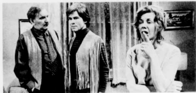
Jean Duceppe et Gérard Poirier

Jean Duceppe, Hubert Gagnon et Denise Filiatrault