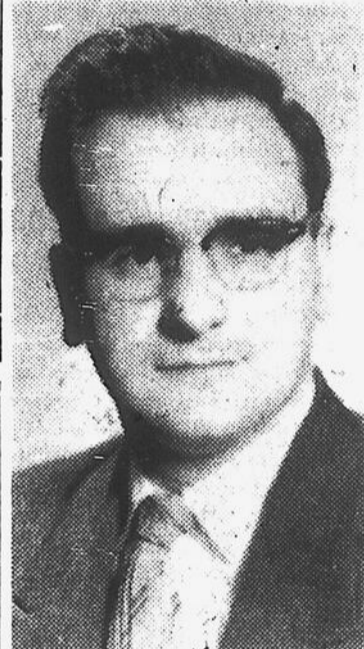
Lundi le 18 janvier, la Société Saint-Jean-Baptiste section masculine, tiendra sa réunion mensuelle au Centre Lacordaire.