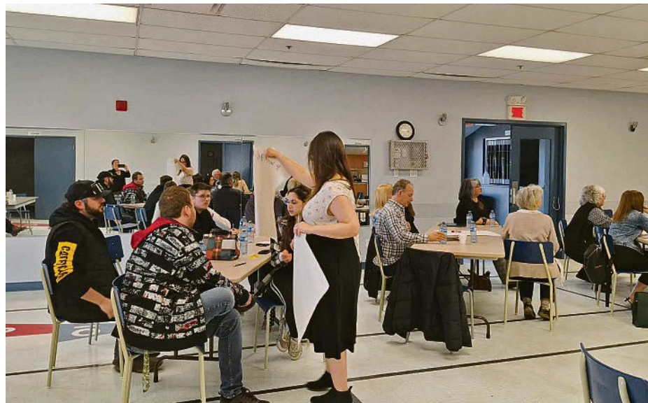
Une table composée de jeunes a su attirer l'attention avec ses idées justes et intelligentes.

La Politique de développement social peut être consultée en ligne sur le site de la MRC d'Acton.