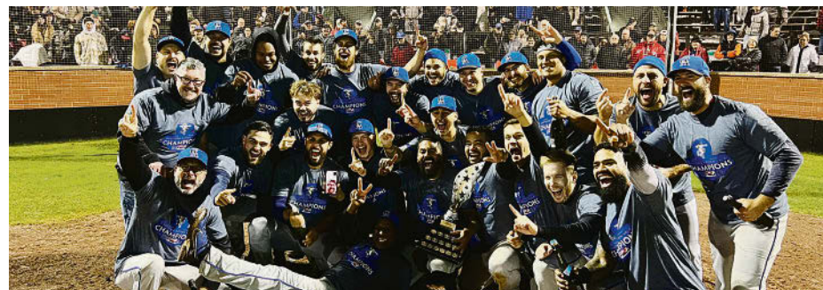
Champions des séries de la LBMQ, les Castors sont prêts à entreprendre la saison 2024.