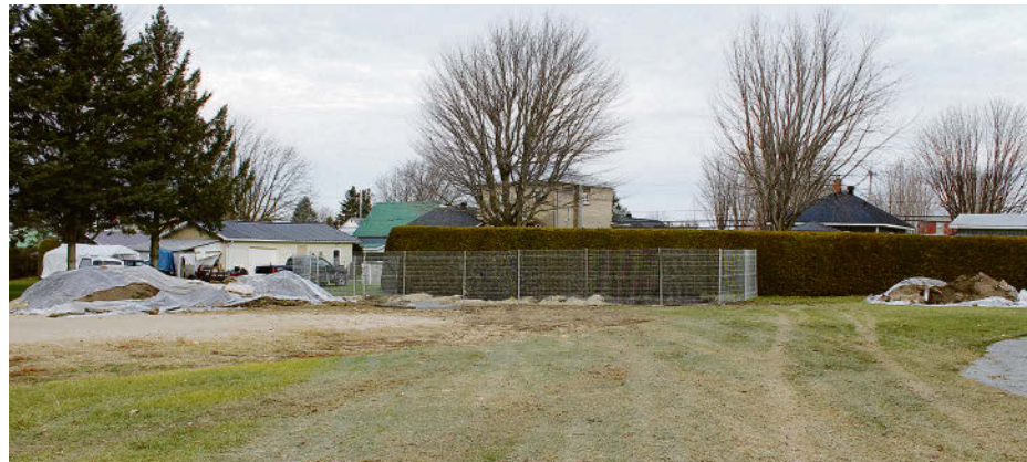
Une partie du terrain où sera construit le futur CPE de Saint-Théodore-d'Acton est contaminée par du manganèse, mais il n'y a pas de risque pour les enfants qui le fréquenteront, assure le ministère de l'Environnement.

Selon le maire Guy Bond, la Municipalité n'avait aucune idée que le terrain pouvait être en partie contaminé au moment de le céder. C'est l'étude des sols réalisée à l'été 2022 qui a révélé qu'environ un huitième du terrain de 30 000 pieds carrés contenait un peu plus de manganèse que la quantité normale. Toutefois, ce ne sera pas sur cette parcelle que sera construit le bâtiment, car il occupera environ un tiers de l'espace.