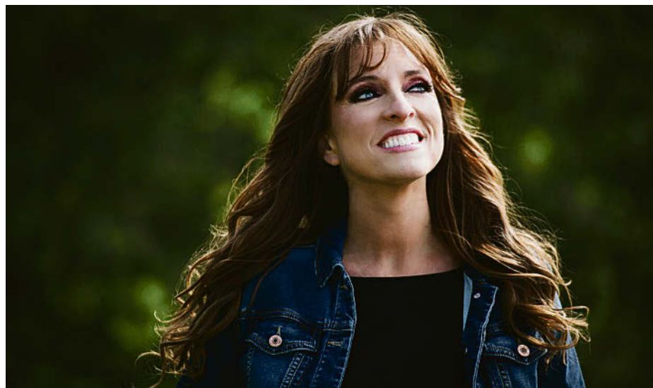
Lynda Lemay sera la première à fouler les planches de l'église Saint-Éphrem, en octobre, dans une programmation de cinq spectacles qui se déroulera jusqu'en mai 2025.

Pour une troisième année, un marché se tiendra au début de la saison estivale, le dimanche 2 juin, juste à côté de l'église. Le Marché d'antan réunira plusieurs artistes, artisans et adeptes de métiers traditionnels. Une section dédiée aux produits locaux sera aussi présentée.