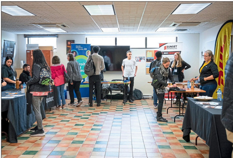
De nombreuses entreprises ont pris part à l'événement qui a attiré 225 personnes à la recherche d'un emploi malgré la pénurie de main-d'œuvre.

Une trentaine de Montréalais ont également pris part au Salon de l'emploi express. Le Quartier de l'emploi avait prévu une visite de la municipalité en autobus.