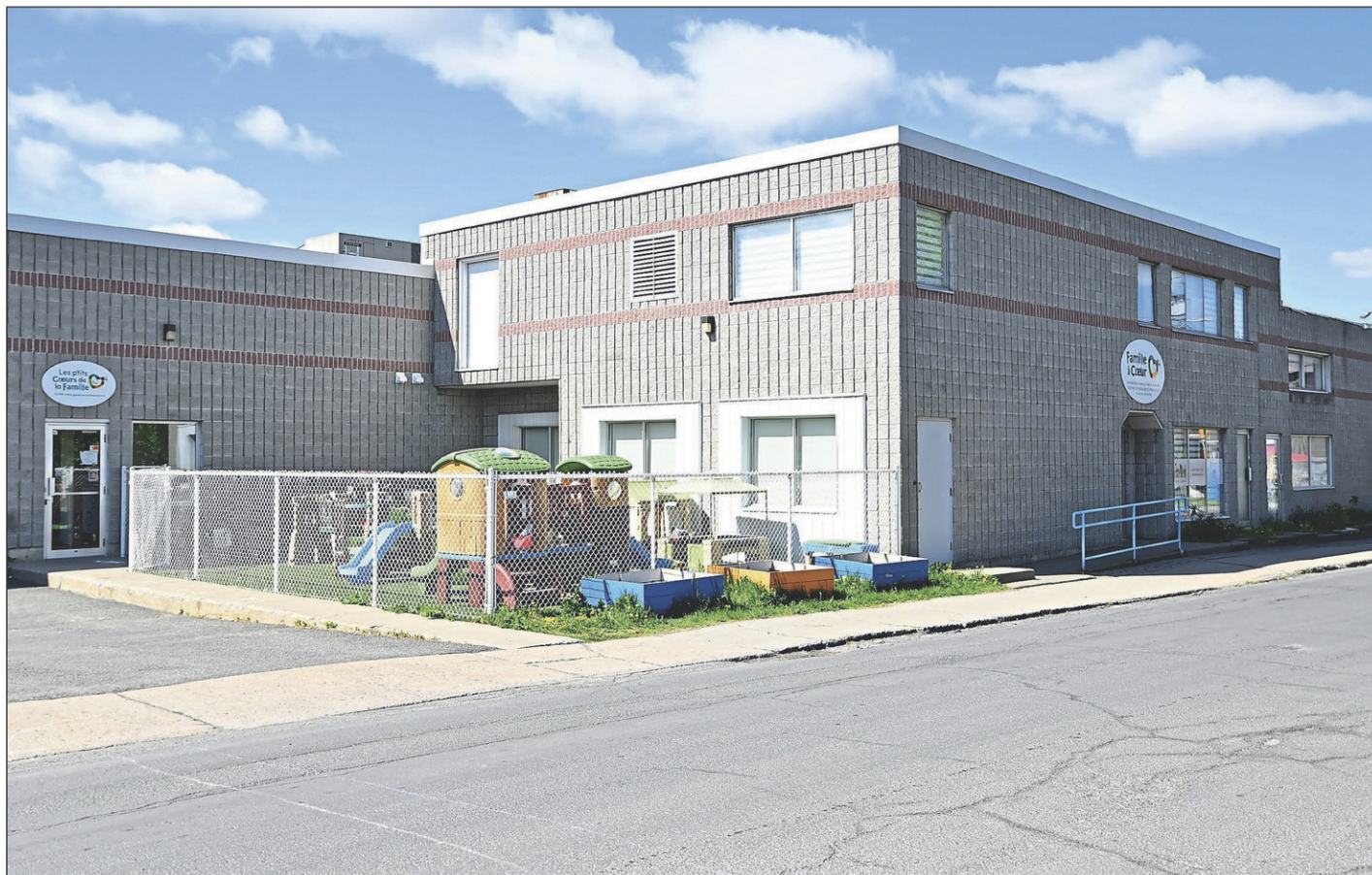
Famille à Cœur reçoit une bourse de 3000 $ pour réaliser la phase 2 de sa halte-garderie.

Pour sa part, l'organisme Famille à Cœur établi sur la rue Saint-Georges, à Saint-Jean-sur-Richelieu, reçoit 3000 $. Ce montant sera destiné à la réalisation de la phase 2 de son projet d'aménagement d'une halte-garderie. Le but est d'optimiser l'espace et permettre ainsi aux enfants