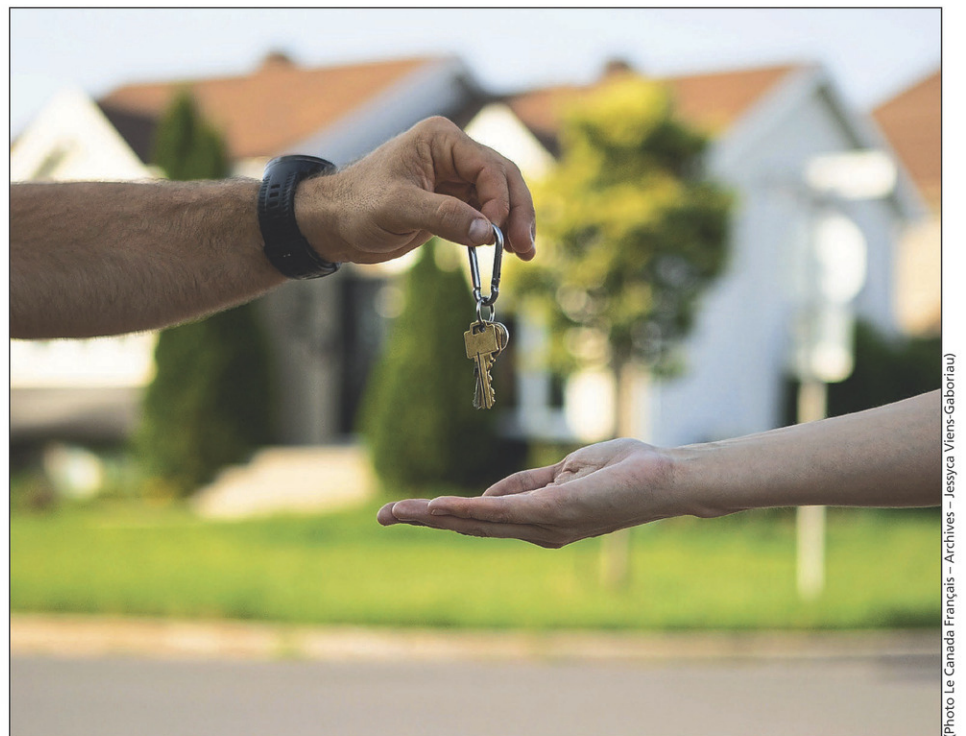
En 2022, la valeur moyenne d'une résidence unifamiliale était de 518 102 $. Le coût de la taxe de bienvenue payée par l'acheteur d'une telle maison était de 6446,06 $.

Si le marché résidentiel a été moins effervescent en 2022 comparativement à 2021, la situation a été tout autre dans le secteur commercial. Selon le bilan annuel 2022 publié par la Division développement économique de la Ville de Saint-Jean-sur-Richelieu, 53 immeubles commerciaux ont changé de propriétaires.