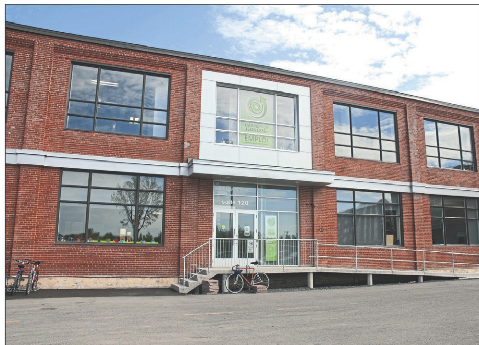
Le brunch aura lieu dans les locaux du Carrefour Jeunesse-Emploi comtés Iberville/St-Jean, situé sur la rue Saint-Paul.

Le brunch aura lieu dans les locaux du CJE comtés Iberville/St-Jean. Ceux-ci sont situés au 215, rue Saint-Paul, suite 120, à Saint-Jean-sur-Richelieu. Les employeurs qui souhaitent y assister doivent confirmer leur présence d'ici le 29 mai au 450 347-4717 ou via pajrhautrichelieu@cje-isj.com.