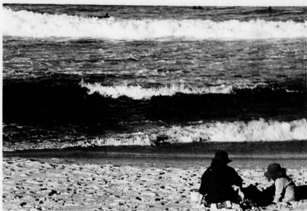
Sur la plage Bronte, à Sydney, en Australie.

Le début de l'année est une excellente saison pour visiter le Portugal. À la fin de mars, les amandiers sont en fleurs et on croirait être devant un spectacle enneigé. En ce qui concerne le logement dans les monastères, cela me semble assez difficile car ils sont