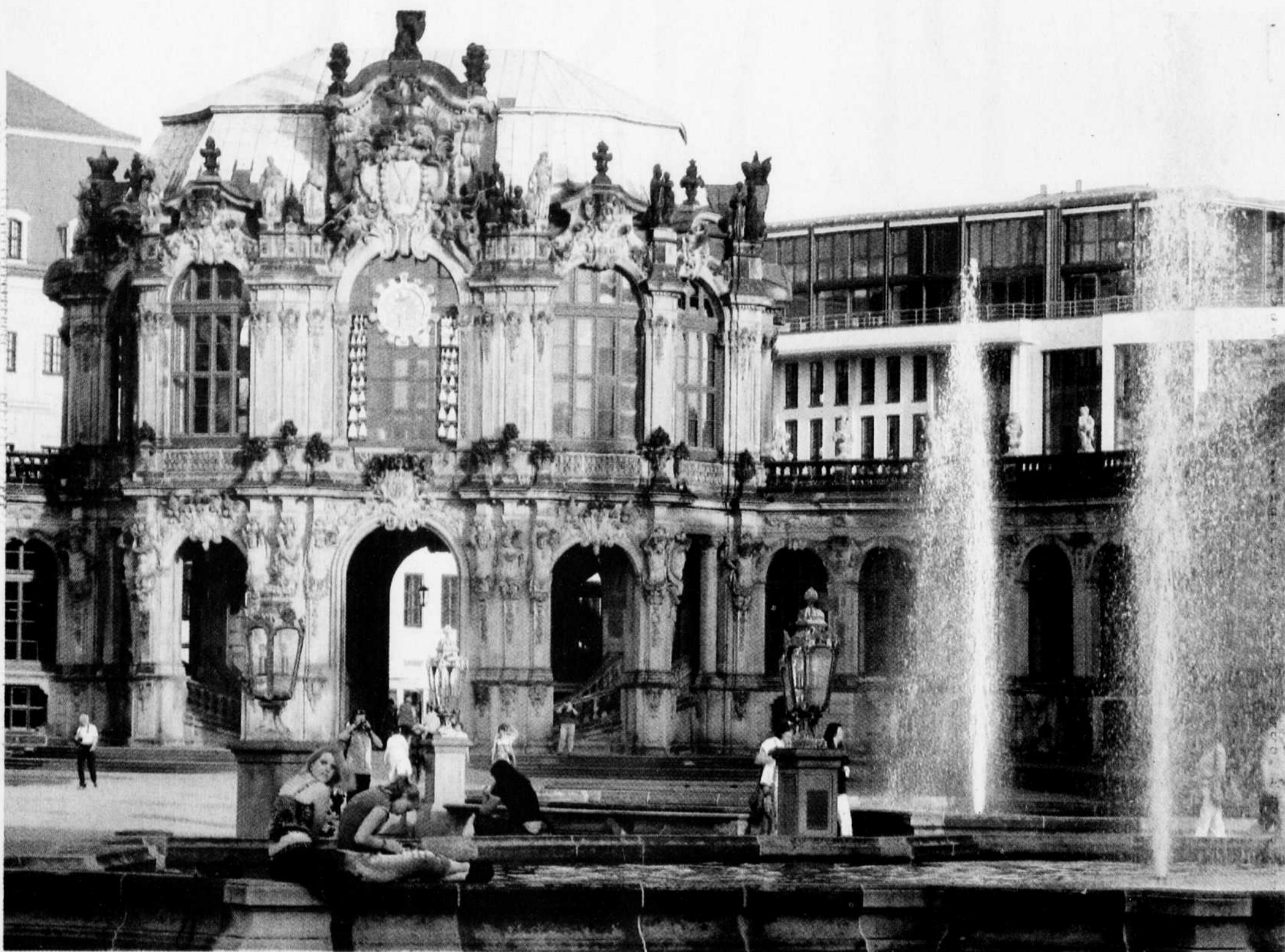
ALEXANDRE SHIELDS LE DEVOIR

La ville de Dresde a pratiquement été rayée de la carte en moins de 48 heures en février 1945, par des bombardements menés par les Américains et les Britanniques, qui y larguèrent plus de 7000 tonnes de bombes incendiaires. Plus de 130 000 habitants périrent. Le centre historique était alors chose du passé. C'est donc dire l'ampleur du plan de reconstruction qui a dû être mis en place, surtout dans l'Allemagne réunifiée.