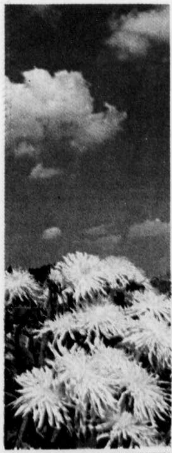
Le pissenlit, une autre plante envahissante

La fleur de l'hibiscus ne dure qu'une journée, trois pour certains cultivars