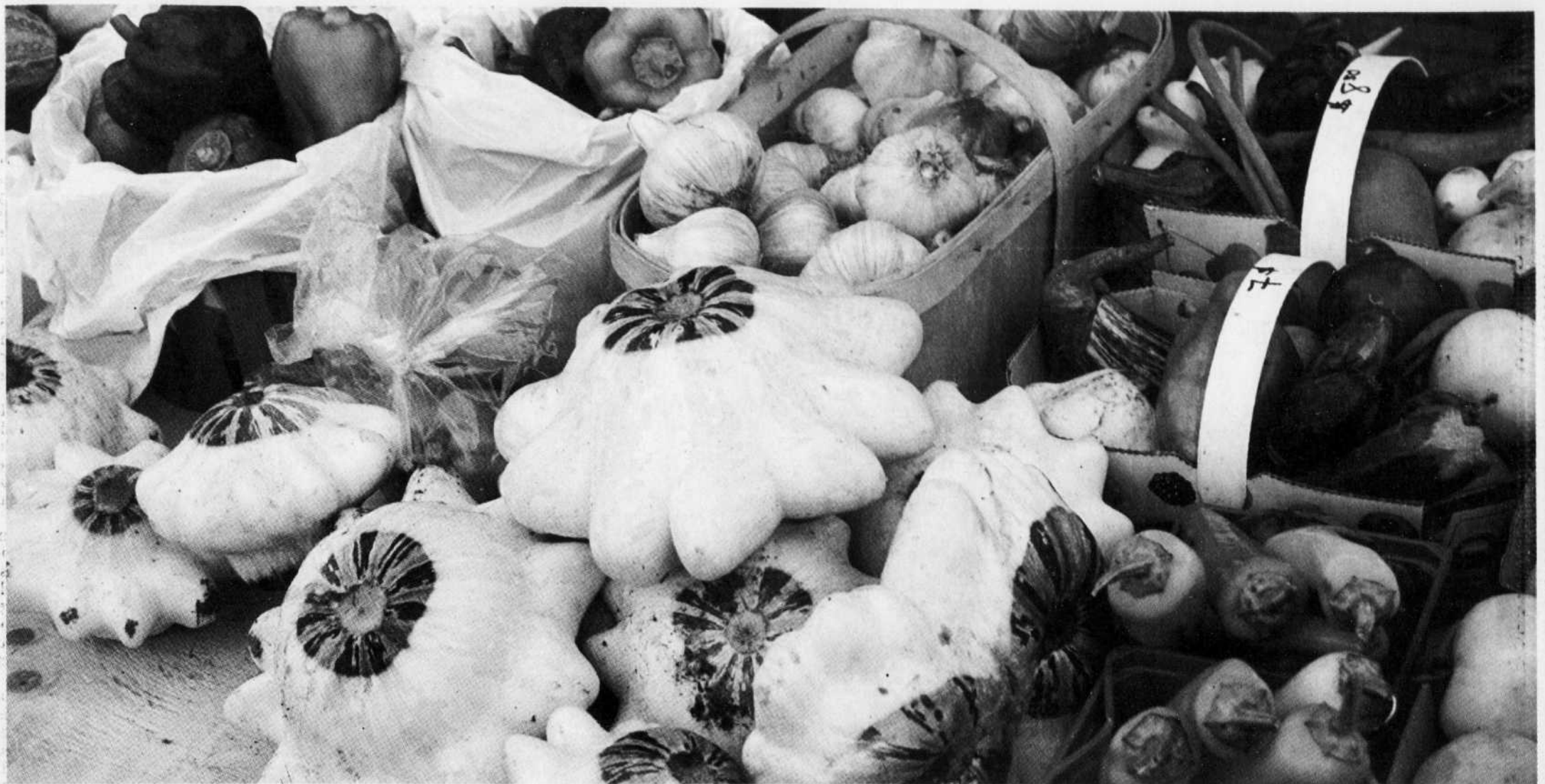
Les légumes de culture biologique de la ferme Bullion, à Saint-André-d'Argenteuil

Depuis trois ou quatre ans, avec l'ouverture des marchés et les campagnes très porteuses du ministère de l'Agriculture, des Pêcheries et de l'Alimentation concernant les produits issus du Québec, le consommateur a un goût de plus en plus raffiné et il est beaucoup plus sensible aux produits de chez nous.