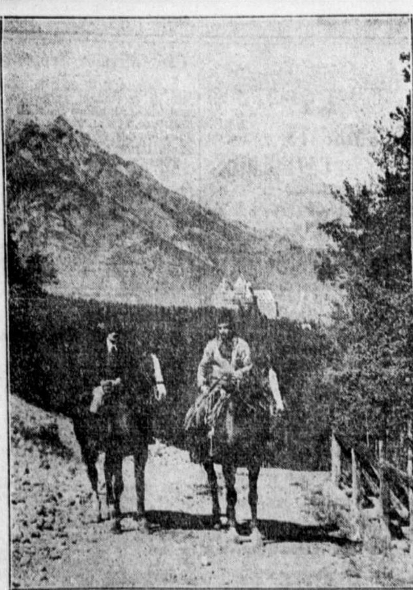
Banff, dont on aperçoit ici au fond le luxueux hôtel "Banff Springs", est probablement la villégiature la plus en vogue dans les Rocheuses. Elle offre aux touristes des attractions et amusements variés, qui y rendent leur séjour parfaitement agréable. Ses bains d'eau chaude sulfureuse sont célèbres dans le monde entier, son terrain de golf est probablement le plus pittoresque d'Amérique et les sentiers qu'elle met à la disposition des cavaliers, pour les promenades, permettent d'admirer d'incomparables panoramas. Les voyageurs de l'Université s'arrêteront à Banff, le 11 juillet prochain, en se rendant à Vancouver par train spécial du Pacifique Canadien.