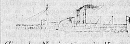
Cie. de Navigation à Vapeur du St. Laurent.