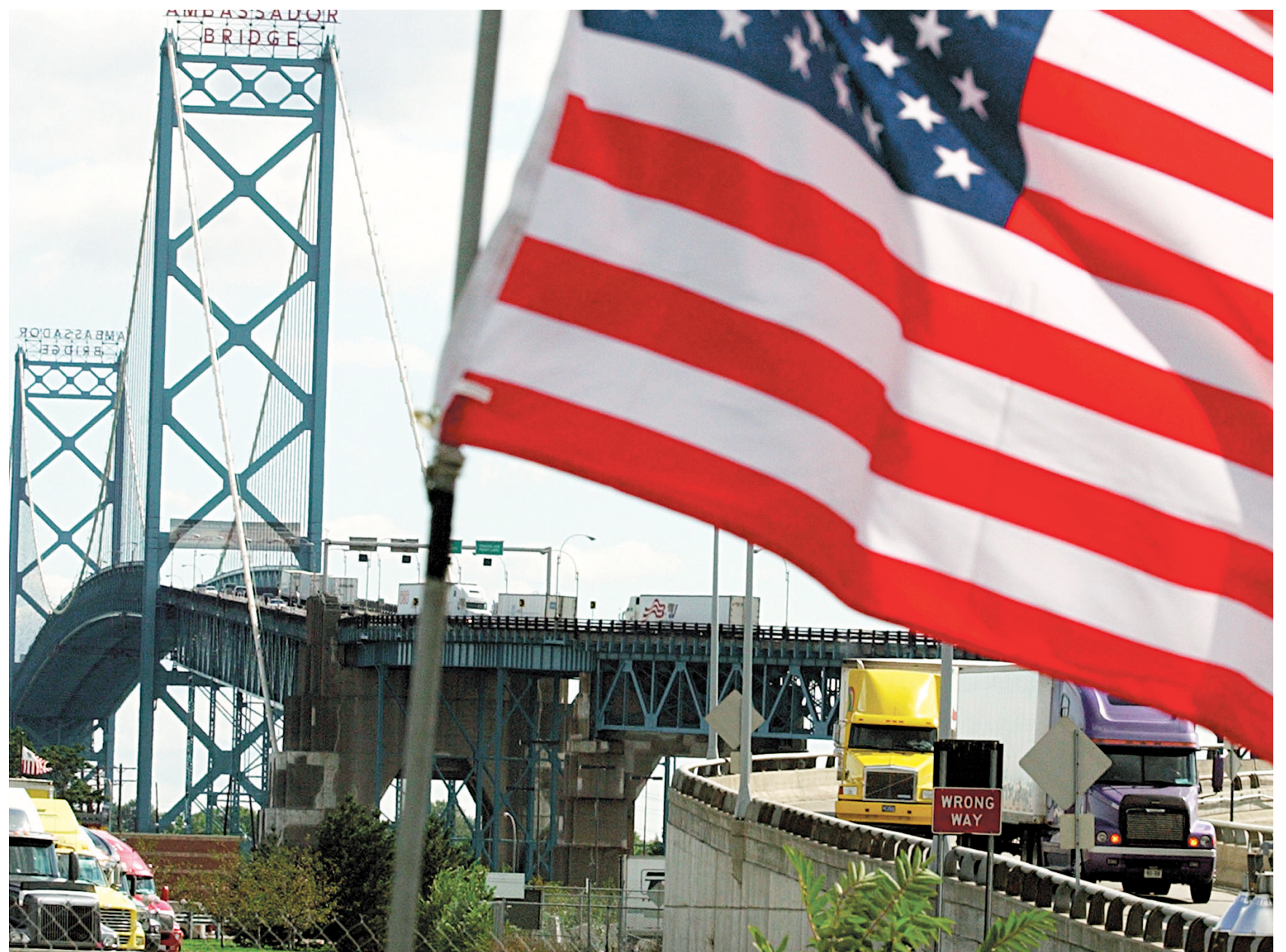
Le pont Ambassador, qui relie Detroit (Michigan) à Windsor (Ontario), par où passe une grande partie des marchandises qui s'échangent entre les États-Unis et le Canada.

Avec l'Associated Press et Reuters Le Devoir