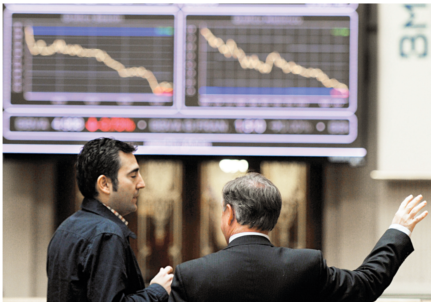
Deux hommes regardent défiler les indices à la Bourse de Madrid. Les marchés européens étaient plutôt calmes hier, en dépit des inquiétudes qui subsistent.