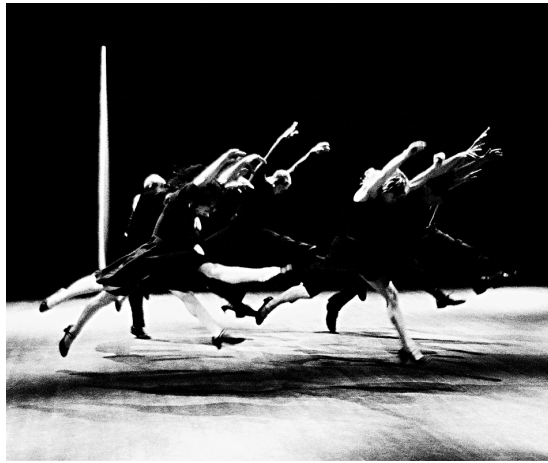
FONDATION JEAN-PIERRE PERREAULT Une scène de la chorégraphie Eironos (1996)

Jean-Pierre Perreault a frappé l'imaginaire du public avec JOE . Sans musique, sinon le bruit des bottes, 24 interprètes, non identifiables sous leurs imperméables et leurs chapeaux noirs, oscillent entre la meute et la solitude.