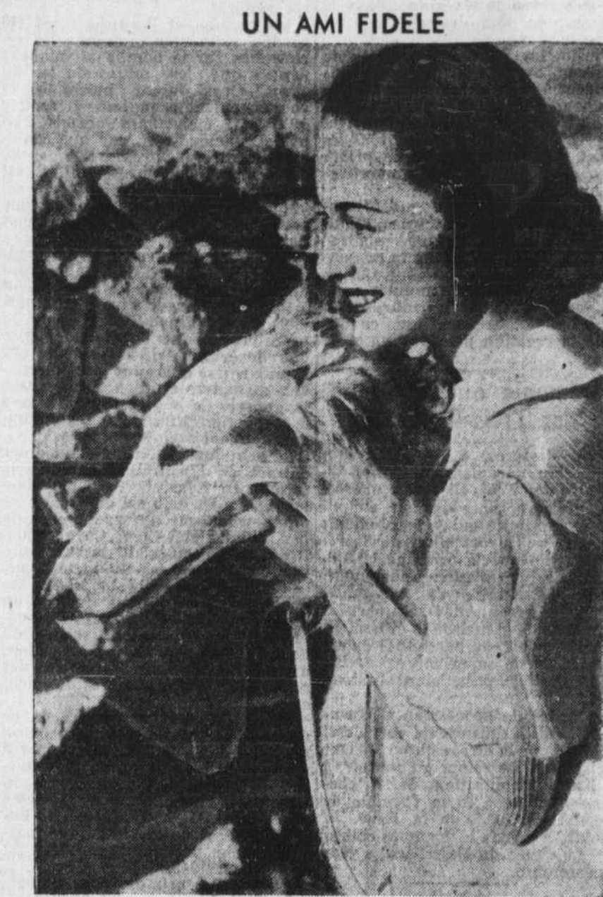
Ce lévrier ne semble pas du tout impatient de reprendre sa liberté. Il est vrai que la géolière est Olivia de Haviland.