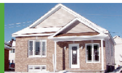
1331 St-René Est