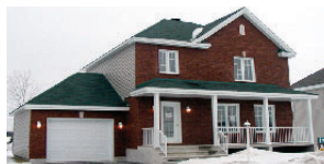
240 des Percherons