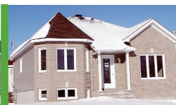
1335 St-René Est