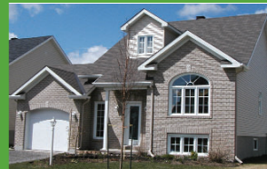
759 Cheval Blanc