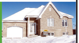
76 de la Fougère