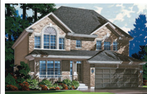
Maisons unifamiliales De 1 649pi à 3 610 pi Terrains de 50 et 60 pieds

La Phase II est maintenant prête! La cour arrière de 75% des maisons donne sur le parcours de golf