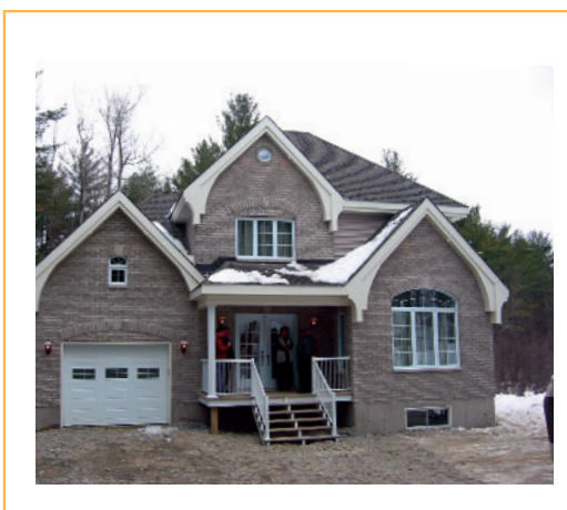
La maison Expohabitat, réalisée par Silvec Construction, qui sera mise aux enchères.

Pour de plus amples renseignements au sujet du Salon Expohabitat de l'APCHQ, vous pouvez communiquer avec son promoteur, Daniel Cardinal, au (819) 328-4710.