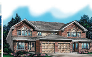
Maisons en rangée et jumelées De 1 450pi à 1 800 pi