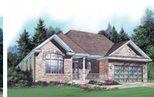
Bungalows De 1 470pi à 1 850 pi Terrains de 50 et 60 pieds