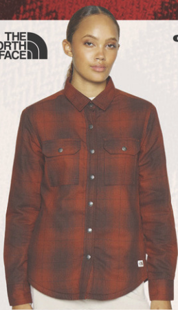
Chemise Campshire N° M193883. Solde 99,95$ Détail sugg.: 149,99$