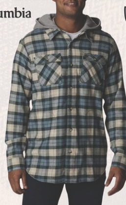
Chemise Flairgun N° M159356. Solde 44,95$ Détail sugg.: 89,95$