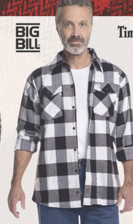
Chemise N° M006463. 74,95$ Détail sugg.: 74,95$