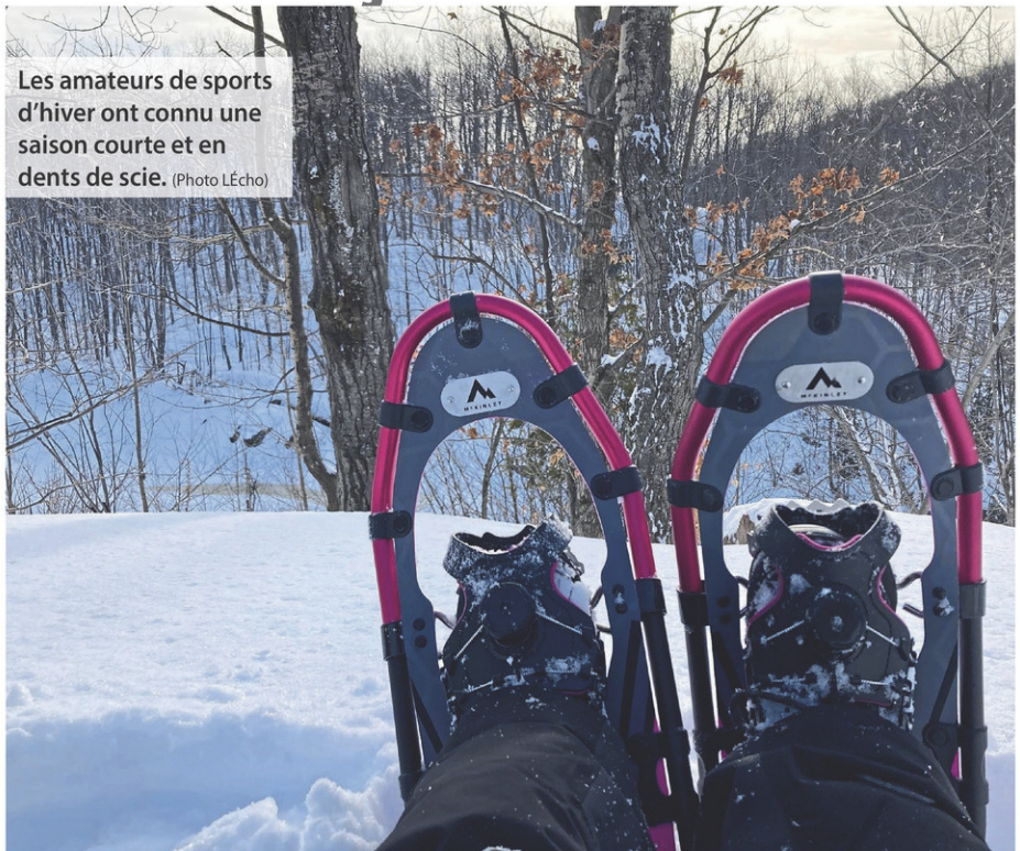
Les amateurs de sports d'hiver ont connu une saison courte et en dents de scie.

Le directeur de Lapointe Sports mentionne qu'il a effectué environ 50% de ses ventes en comparaison aux dernières années. « Pendant la pandémie, c'était comme irréaliste ce qui se passait. Je dirais qu'on retombe à quelque chose de plus normal et là, on tombe au plus bas. Donc on va essayer de retrouver un équilibre dans la prochaine année ». Il poursuit avec un ton optimiste, « c'est sûr qu'on ne pourra pas vraiment rattraper ce qu'on a manqué, mais on sent déjà un engouement pour ce qui est de la saison d'été ».