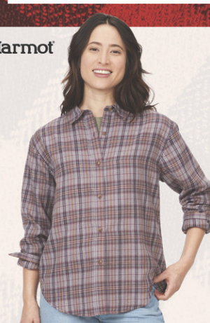
Chemise Fairfax Novelty Lightweight N° M191724. Solde 69,95$ Détail sugg.: 99,95$