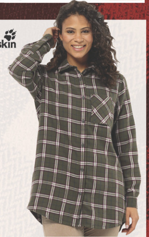
Chemise Morgenluft N° M192576. Solde 74,95$ Détail sugg.: 129,95$