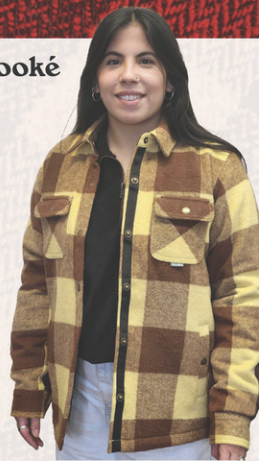
Chemise Canadian N° M188689. 179,99$ Détail sugg.: 179,99$