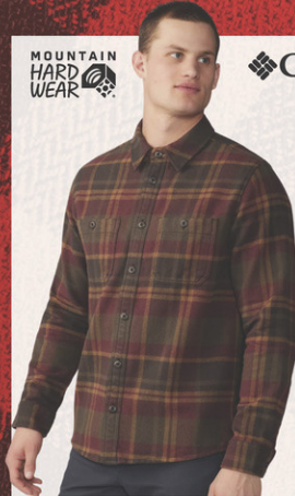
Chemise Plusher N° M180562. Solde 69,95$ Détail sugg.: 109,95$