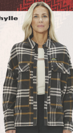
Chemise Hailey N° M194622. Solde 59,95$ Détail sugg.: 124,99$