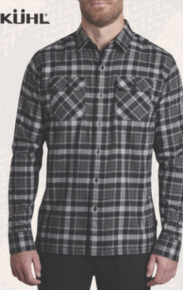
Chemise Dillingr N° M185915. Solde 79,95$ Détail sugg.: 119,95$