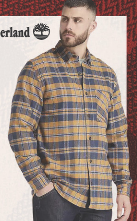
Chemise Woodfort N° M186087. Solde 49,95$ Détail sugg.: 89,95$