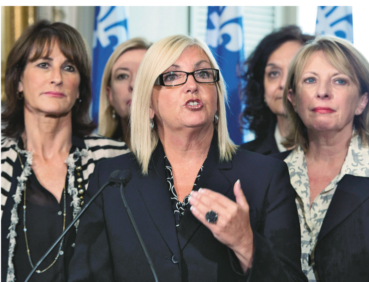
Kathleen Weil, Maryse Gaudreault et Christine St-Pierre pourraient toutes se voir confier un ministère. Mais Philippe Couillard ne promet pas la parité au Conseil des ministres.