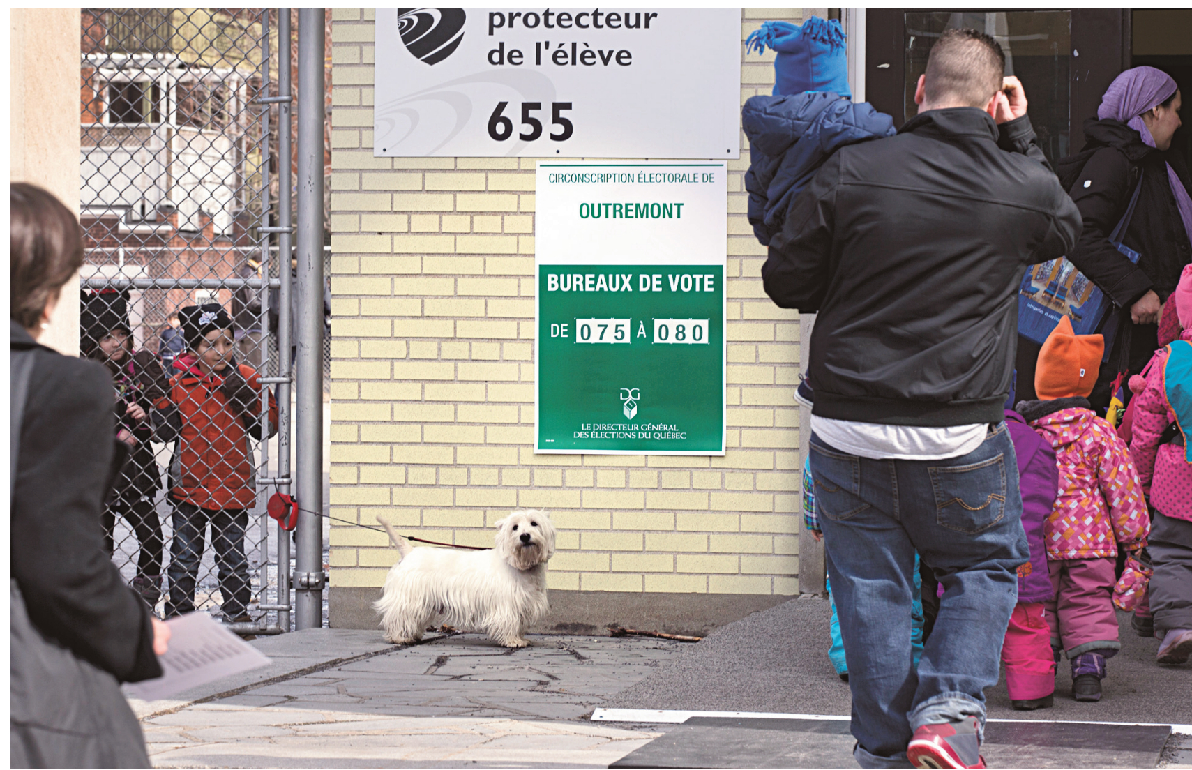
Le taux de participation de lundi est légèrement supérieur à 71%. Il fut de 74,6% aux élections de 2012.

Lire aussi : Les distorsions les plus importantes depuis 1998. Une lettre ouverte de l'auteur Paul Cliche. Page A 9