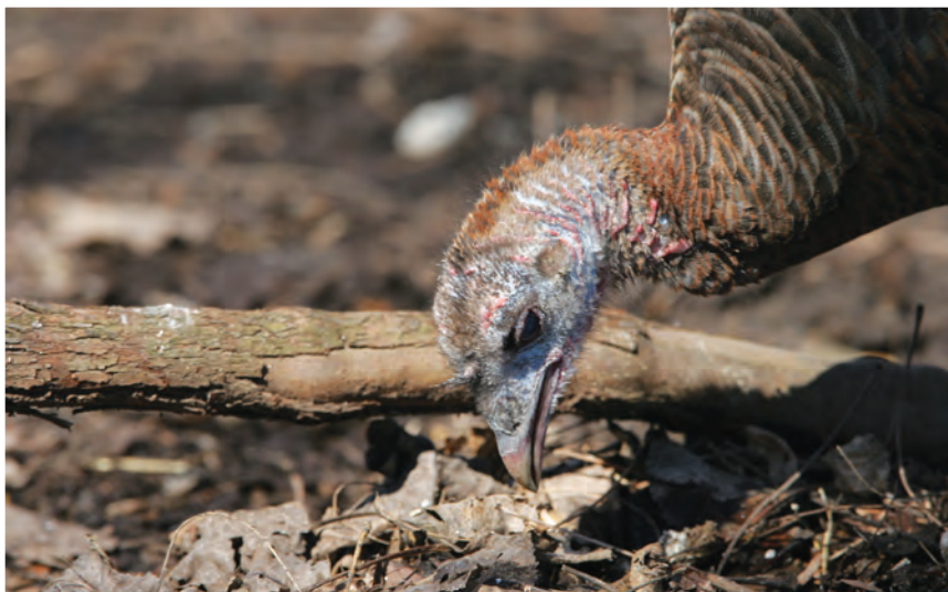
Dindon sauvage

En 2013-2014, le Regroupement a entrepris des démarches de conservation auprès des propriétaires de quatre milieux humides fréquentés par le Petit Blongios (Hudson, Sainte-Anne-de-Sabrevois, Laval et Brossard). En tout, 18 propriétaires ont été sensibilisés à l'importance de préserver les milieux humides de leur terrain pour la survie du Petit Blongios. Cette sensibilisation s'est effectuée à l'aide de rencontres, de discussions et de remises de documents