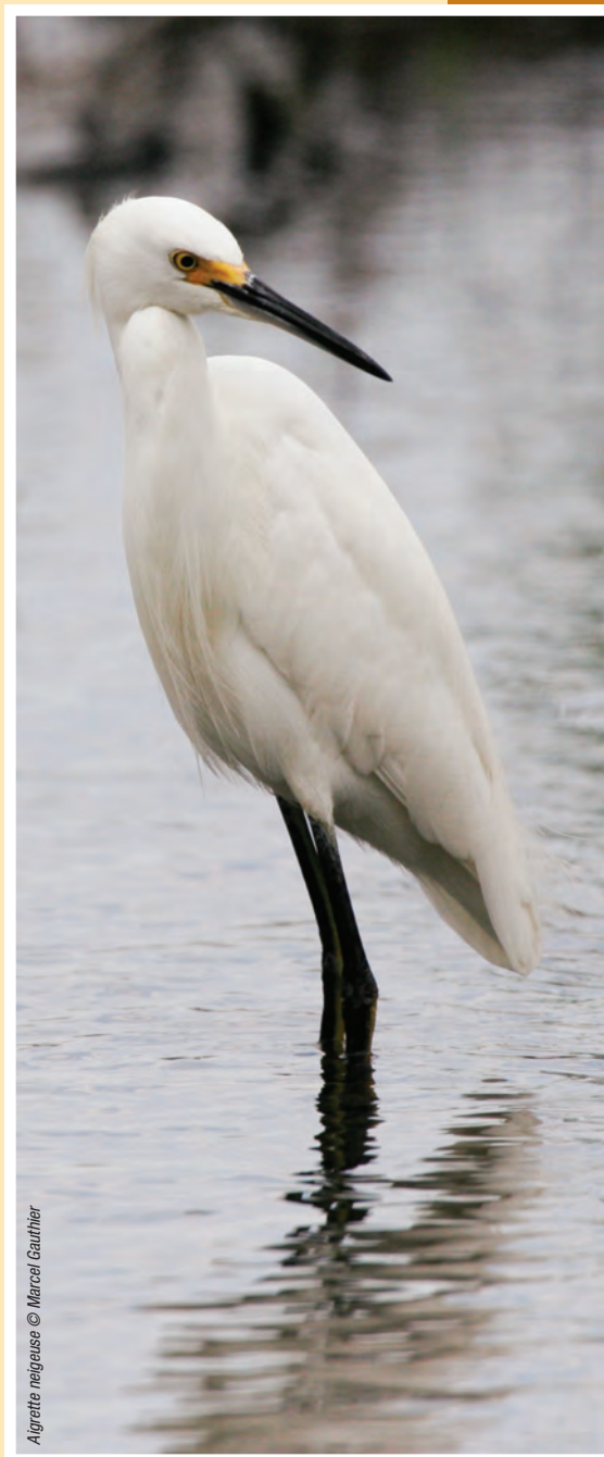
Algrette neigeuse