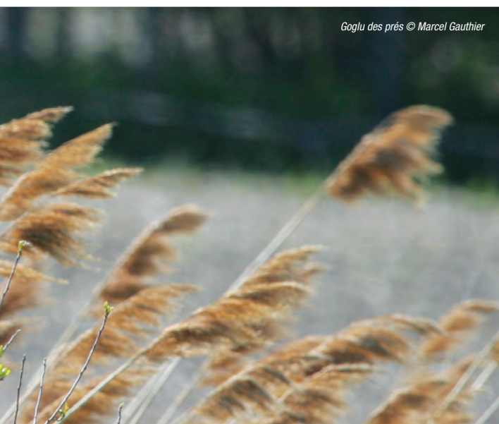
Goglu des prés © Marcel Gauthier

Un coup de pouce aux Martinets ramoneurs de Lac-Mégantic s'est avéré nécessaire en réponse aux perturbations causées par les événements tragiques survenus en juillet 2013. Dans le cadre de la reconstruction du centre-ville de la municipalité, le site d'un important dortoir de Martinet ramoneur, l'église Notre-Dame-de-Fatima, a été démolie pour relocaliser des commerces qui ont été détruits ou endommagés lors de la tragédie. En collaboration avec les intervenants du milieu, des démarches d'intendance ont été entreprises dans la région de Lac-Mégantic afin de protéger d'autres sites existants (cheminées) ou pour rendre à nouveau accessible des sites historiques utilisés par le Martinet ramoneur. Les dirigeants de Métro se sont engagés à construire un dortoir qui pourra être installé à Lac-Mégantic. Le conseil de la Fabrique de l'Église Sainte-Agnès a accepté de retirer le grillage de la cheminée du presbytère afin que les martinets y aient accès au printemps 2014. Le propriétaire de l'édifice du magasin Bureau Plus a