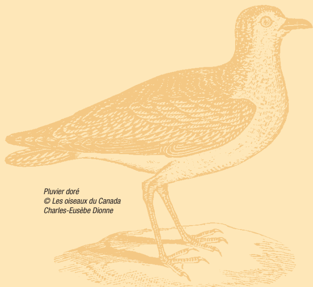
Pluvier doré © Les oiseaux du Canada Charles-Eusèbe Dionne