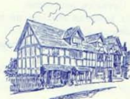
Shakespeare's Birthplace Stratford-on-Avon

"I would give all my fame for a pot of ale" Henry V. Act 3 Sc. 2