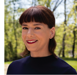
Marie-France Laflamme Communications

Détentriche d'un DESS en développement économique communautaire de l'Université Concordia, Roselyne possède une connaissance approfondie des enjeux touchant la ruralité, le marketing territorial et le développement des PME en milieu rural. Collaboratrice de la SADC depuis 2009, elle coordonne et participe à de nombreux projets de développement économique local, en plus d'accompagner les entrepreneurs dans la réalisation d'études de faisabilité et de projets de développement durable.