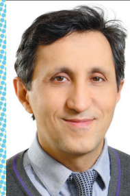
Amir KHADIR Député de Mercier, Québec solidaire