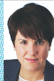
Djemila BENHABIB Auteure de Ma vie à contre-Coran