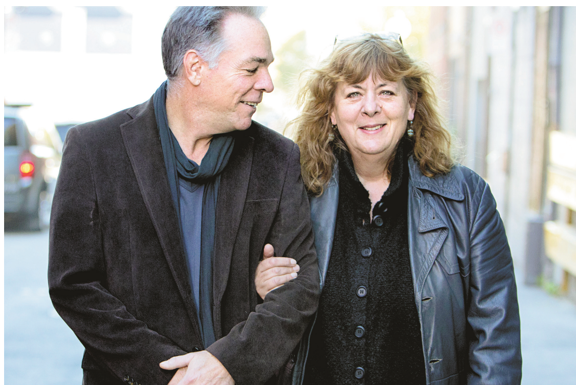
Une coréalisation de Luc Bourdon et Alice Ronfard allait de soi...