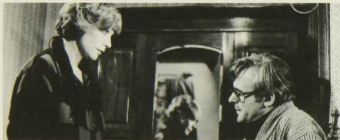
Shirley MacLaine et Anthony Hopkins