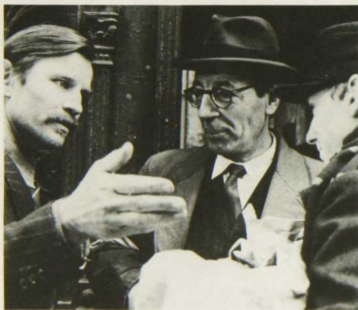
Michael York, Jean Bouise et Jacques Penot

Une fois libres, les Polo reprennent leur long voyage. Marco est enthousiasmé par le fait que, chaque jour, presque derrière chaque colline, des nouveautés les attendent et des défis les provoquent. Ainsi, durant leur périple à travers la Perse, le Khorassan et l'Afghanistan, ils iront de surprises et d'épreuves en emballements. Nous laissons aux téléspectateurs le plaisir sans cesse renouvelé de découvrir cette page de notre histoire.