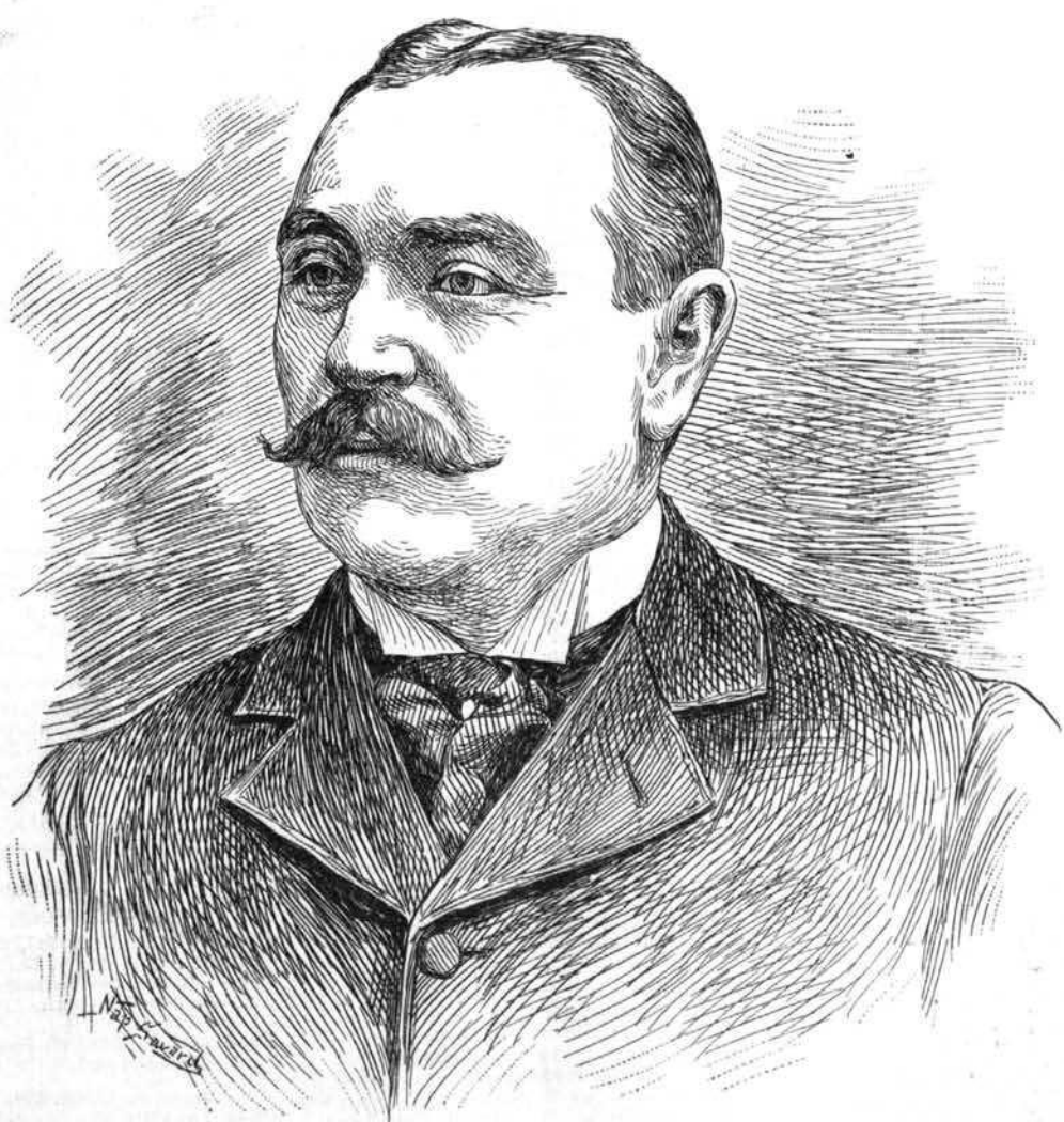
Dessin de N. SAVARD, d'après une photographie de Laprés & Lavergne.

BUREAU 58 Rue St-Gabriel, Montreal Boite 2169