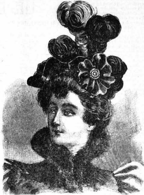
LA MODE — CHAPEAU DE PROMENADE

fois l'aïeule et repris sa place, en tête du bataillon de Vendée.