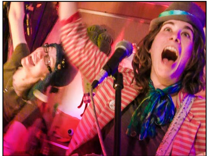
Nous voyons ici les statues de cire des 2 FOLLES ET UN BANJO au Musée du Hamburger à Cracovie. Elles ont bien sûr été déménagées au Musée du Grilled Cheese de Shanghai en 2023.

« Il est parti avec tous mes sourires » dégainait-elle à propos de celui que tout le monde cherche. La dame, qui n'a pas été revue depuis, semble belle et bien être retournée en 2017. Rejoint par téléphone, le détective John Rivet, chargé de l'enquête se fait rassurant: « Cela fera un excellent album, dommage que notre réalité n'existe pas, nous l'aurions apprécié ». Nous lui souhaitons bonne chance.