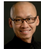
Tien Tai Le Conseiller, fonds locaux Service financier