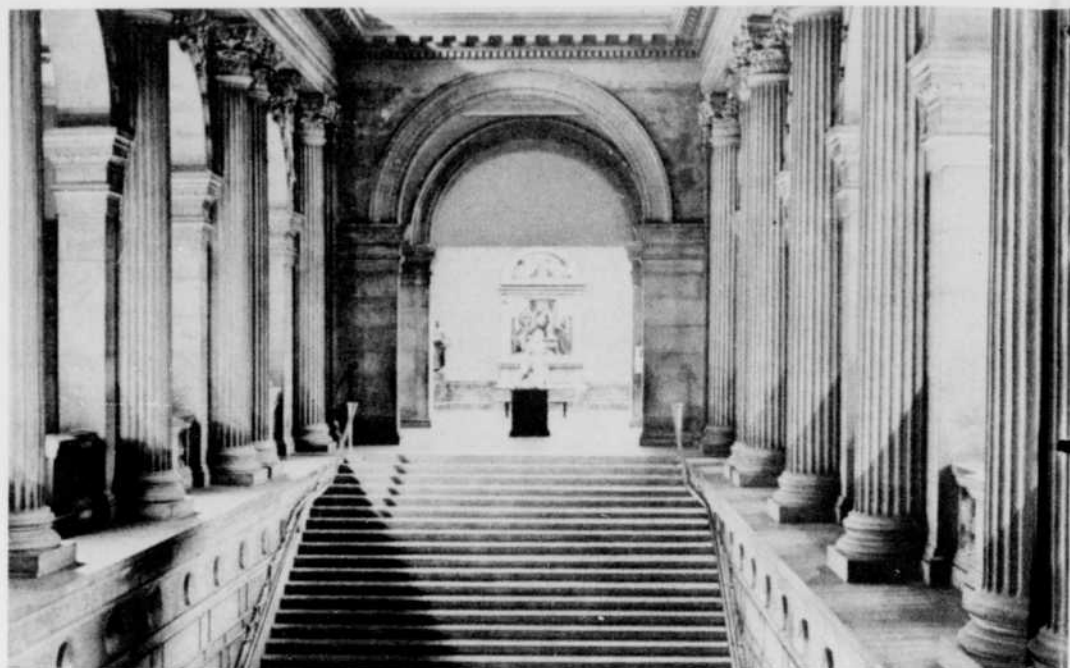
Robert Choquette a écrit d'émouvants poèmes sur le Metropolitan Museum qui seront dits à l'émission Sur les boulevards . Ci-dessus, l'objet de son inspiration.