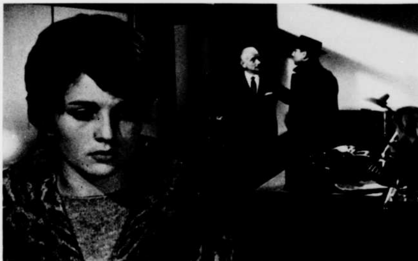
Une scène du film « Deux hommes dans Manhattan ».

Pour qui ignore le nom de Jean-Pierre Melville, disons qu'il est né en 1917. Avant la guerre, il était représentant de commerce. Il passa le temps de la guerre en Angleterre. De retour en France, il devient réa-