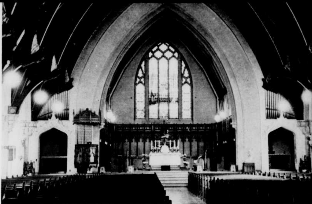
La chapelle du collège Saint-Laurent

Pour Radio-Canada, ces concours permettent de découvrir de nouveaux auteurs. Pour les jeunes, ils peuvent être le point de départ d'une activité littéraire et la découverte de leur propre talent.