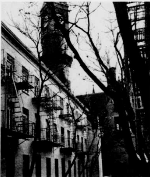
Un coin du pittoresque quartier de la bohème new-yorkaise : Greenwich Village.

Si vous aimez vous promener, rendez-vous Sur les boulevards de New York et de Paris, dimanche prochain.