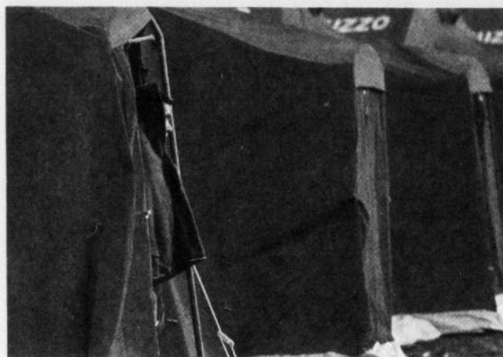
Des milliers de personnes ont trouvé refuge sous la tente.

Plus de 17 000 sans-abri, 1500 blessés et 235 morts: le bilan du séisme qui a ébranlé la région italienne des Abruzzes a continué de s'alourdir hier, alors que de nouvelles secousses ont tué au moins une personne et compliqué le travail des secouristes.