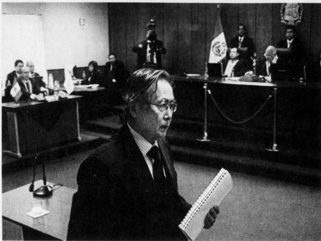
Alberto Fujimori, peu après le prononcé de sa sentence, hier

Fujimori était jugé pour son rôle dans deux tueries qui firent