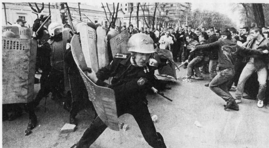
Pour la deuxième journée, les affrontements ont été violents hier, à Chisinau.

Pour la seconde journée consécutive, quelque 10 000 personnes, principalement des étudiants, se sont rassemblées dans le centre de la capitale pour dénoncer le résultat de l'élection qui donnait 50 % des voix au parti de Voronine. Son successeur doit être élu par le prochain Parlement entre le 8 avril et le 8 juin.