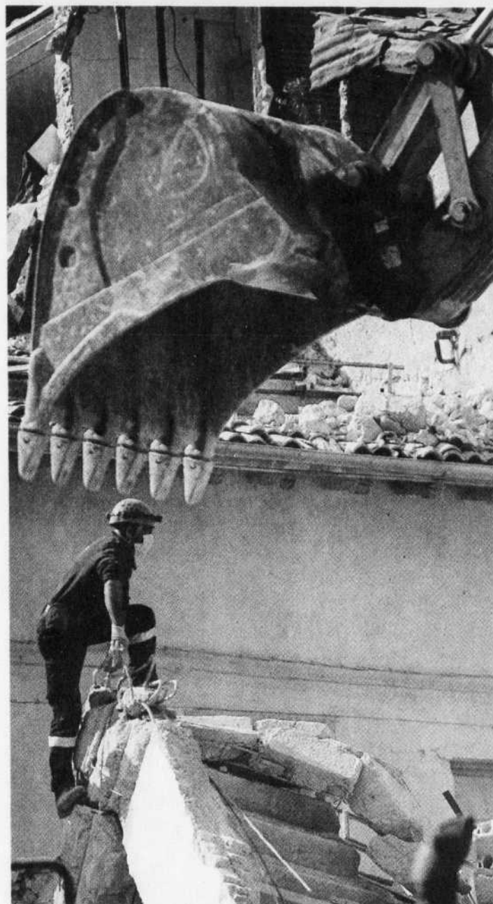
Les secouristes ont continué à fouiller les débris, hier, en dépit des répliques qui ont compliqué leur tâche.

« Les chances de retrouver quelqu'un de vivant sous les gravats sont désormais très minces »