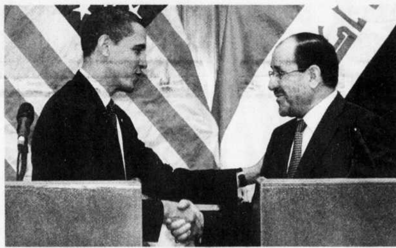
Barack Obama et le premier ministre irakien, Nouri al-Maliki