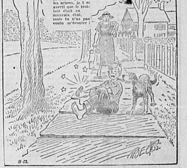
par Will Disney