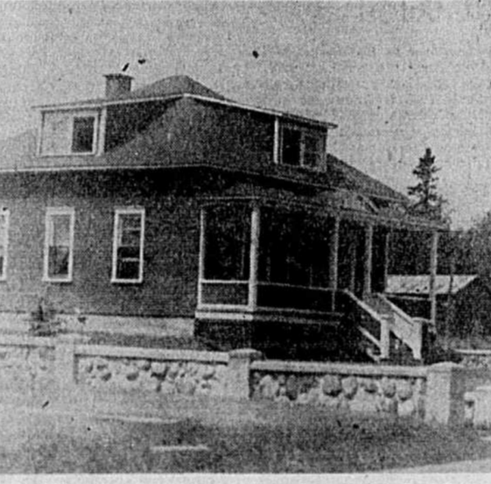
Pont-Rouge — Photo de la propriété de M. Sylva Julien qui a remporté le premier prix lors du concours d'embellissement tenu récemment à Pont-Rouge, sous les auspices de l'A. J. C., Lafleche.