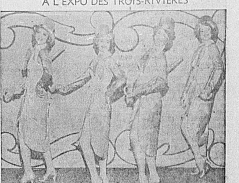
"LES FANTAISIES 1952"

POUSSINS et DINDONNEAUX. Nous offrons des poussins de plusieurs races pures ou croisées aussi des dindonneaux pur sang.