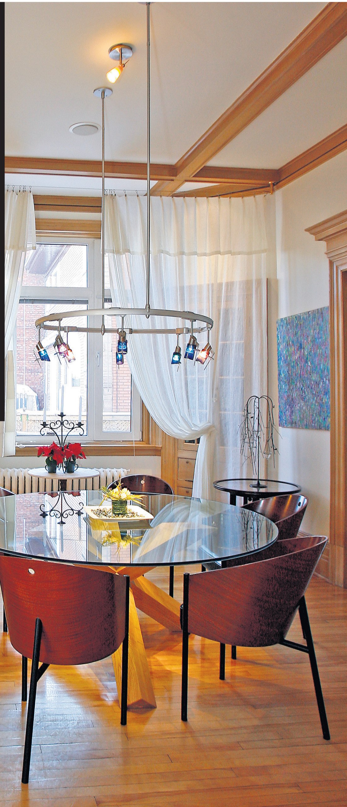
La maison, autrefois lourde et sombre, a repris des couleurs. Les boiseries et les parquets blonds d'origine se marient au contemporain: table Cassina, chaises Philippe Starck, rail d'éclairage de Bazz monté en plafonnier, œuvre en relief de Michel Fortier.

UN REPORTAGE DE MARIE-FRANCE LÉGER, EN PAGES 1 À 4