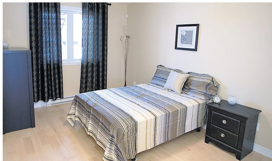
La chambre principale est de bonne dimension.