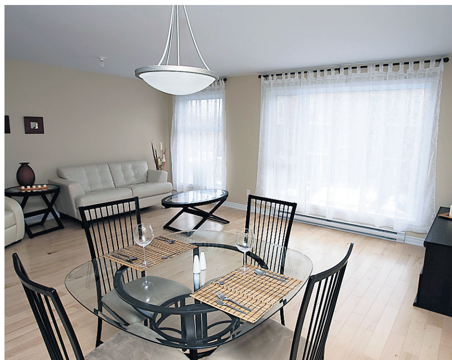
Ceux qui le désirent peuvent subdiviser la salle de séjour et ériger un mur entre les deux fenêtres pour obtenir une troisième chambre. Le vaste espace ouvert est aussi très apprécié.