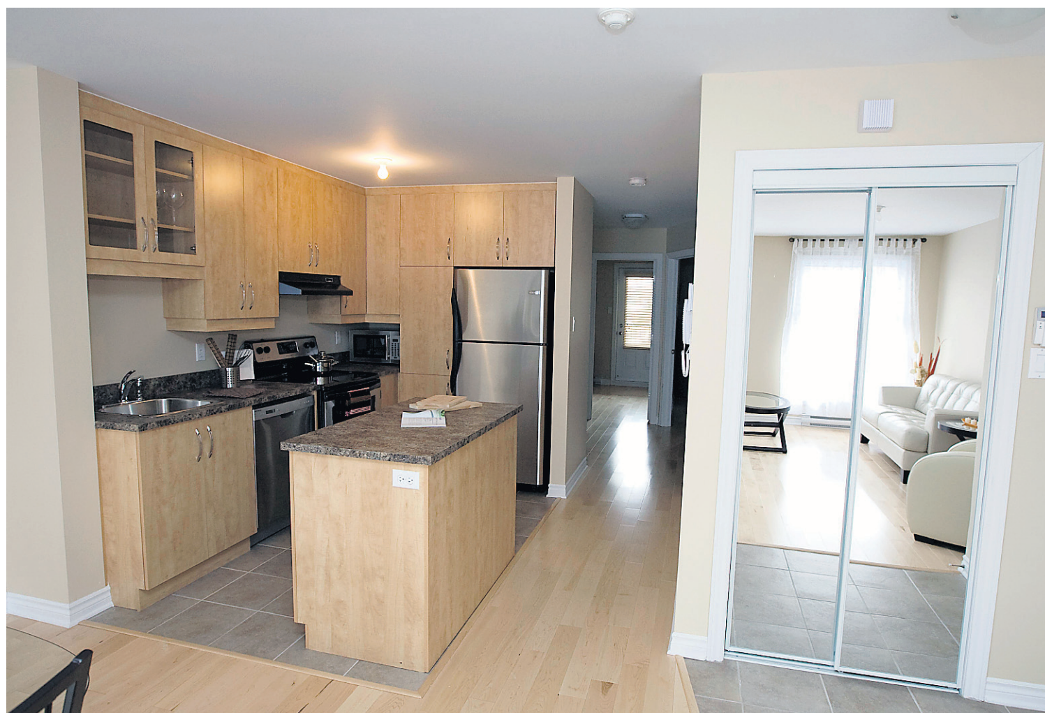
Les logements sont spacieux. Une troisième chambre peut être aménagée dans les trois quarts des appartements.

Adresse et site internet: Bourg Viau 2062, rue Viau www.samcon.ca