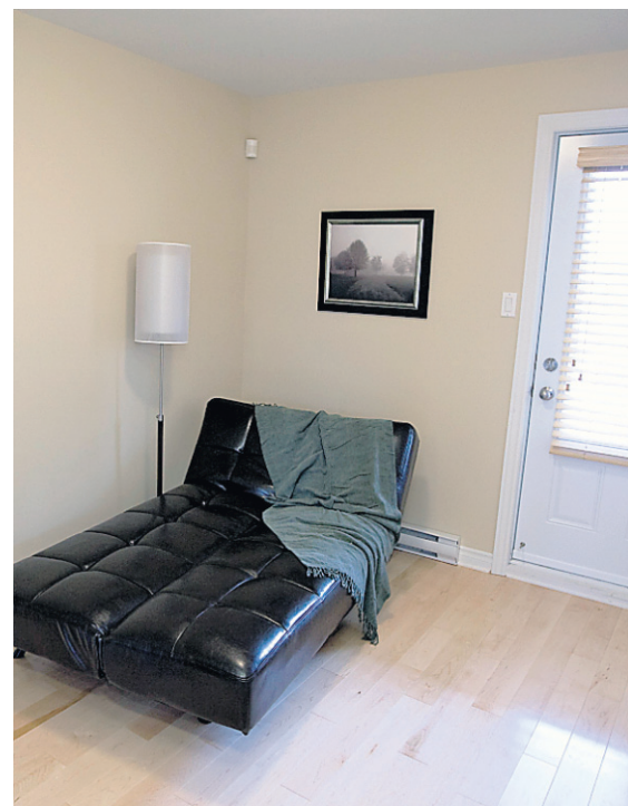
La porte arrière, dans la deuxième chambre, donne accès à un grand balcon, sur lequel une table, des chaises et un barbecue peuvent être installés.