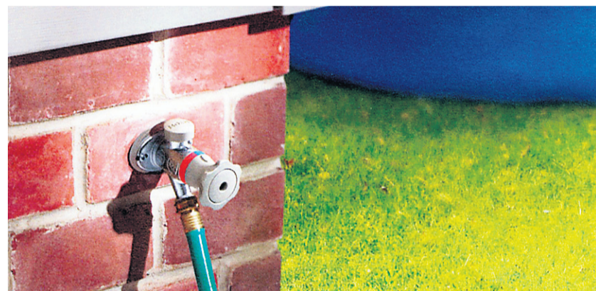
En un tour de main, on peut maintenant régler la température de l'eau.