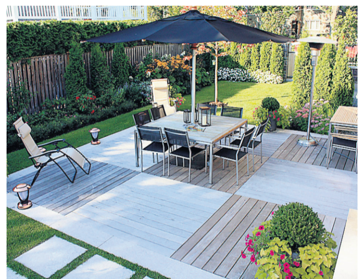
Prix Milan Havlin 2009 pour le projet Confort et élégance: coin repas et coin détente font partie du projet primé de Daccord Webster Paysage de Montréal.

Voyez plus de photos des jardins sur cyberpresse.ca/paysagistes