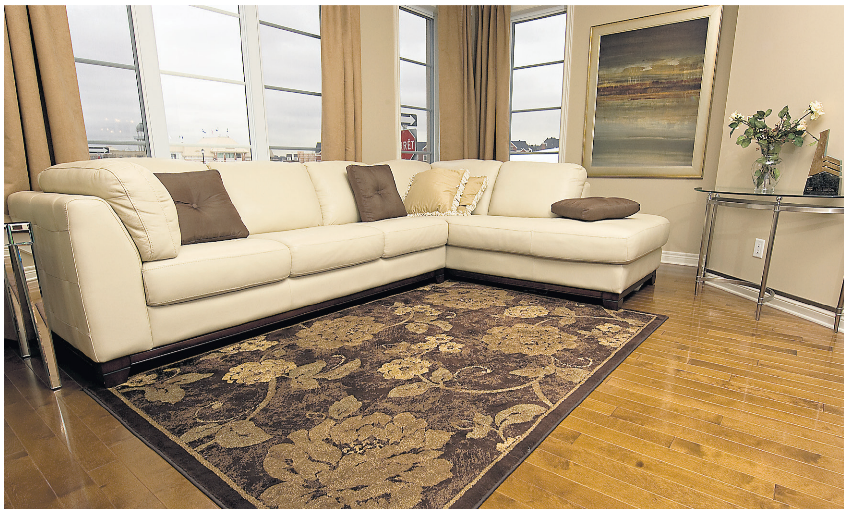
Ce salon possède plusieurs caractéristiques vertes, qui ne sautent pas nécessairement aux yeux. La pièce étant orientée vers le sud, de grandes fenêtres laissent entrer la lumière. L'ossature de la maison est faite de bois certifié FSC. Le parquet préverni est fait d'une essence de bois local (non exotique). La peinture est sans COV.

Certains constructeurs offrent déjà des forfaits verts. C'est le cas,