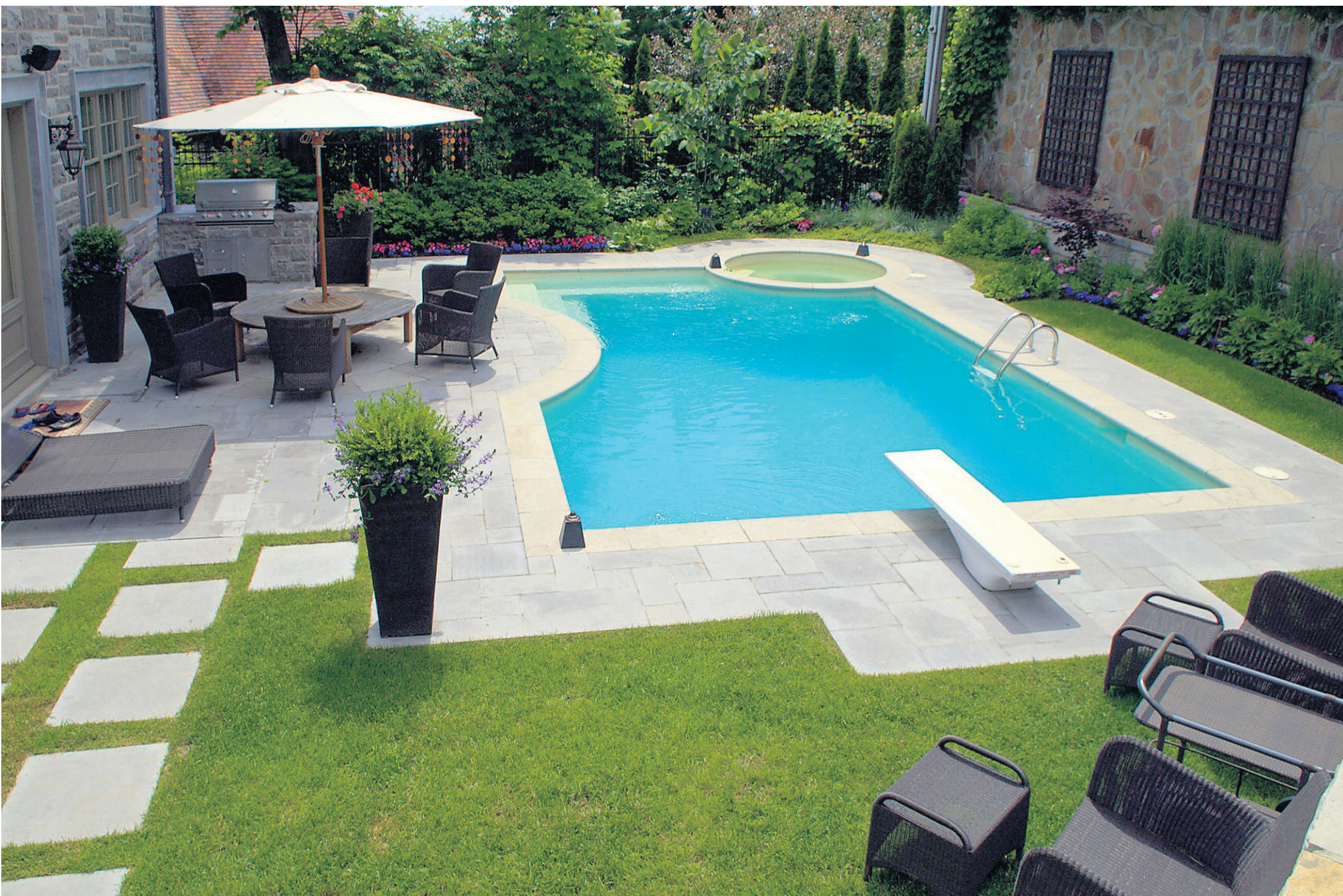
1 er prix dans la catégorie Côté cour 20 000 $ et plus : projet l'Azure, signé Daccord Webster Paysage de Montréal.