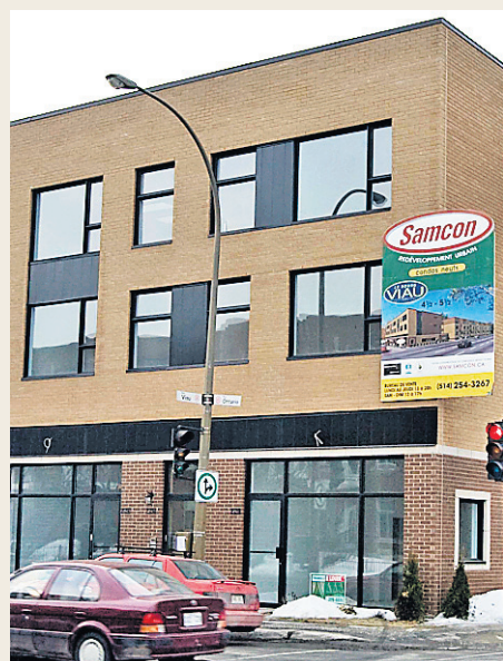
Le Bourg Viau est situé à l'intersection des rues Viau et Ontario.

Projet: Bourg Viau. Promoteur: Samcon. Architecte: Marco Manini. Nombre d'habitations: 56 appartements en copropriété, répartis dans neuf bâtiments en rangée. Il reste 13 unités à vendre. Superficie des appartements disponibles: de 917 à 1086 pieds carrés. Prix: de 189 900 $ à 234 900 $ (taxes incluses). Construction: les 13 appartements sont à compléter, selon les goûts des clients. Quartier: Hochelaga-Maisonneuve. Où: à l'intersection des rues Viau et Ontario, le long des deux artères.