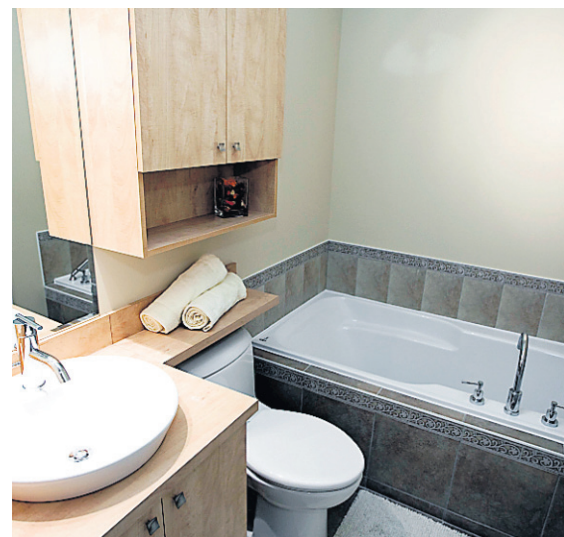
La salle de bains est compacte, mais fonctionnelle. Elle compte également une douche.

CYBERPRESSE.CA MONTOIT Visitez d'autres projets de condos sur cyberpresse.ca/condos