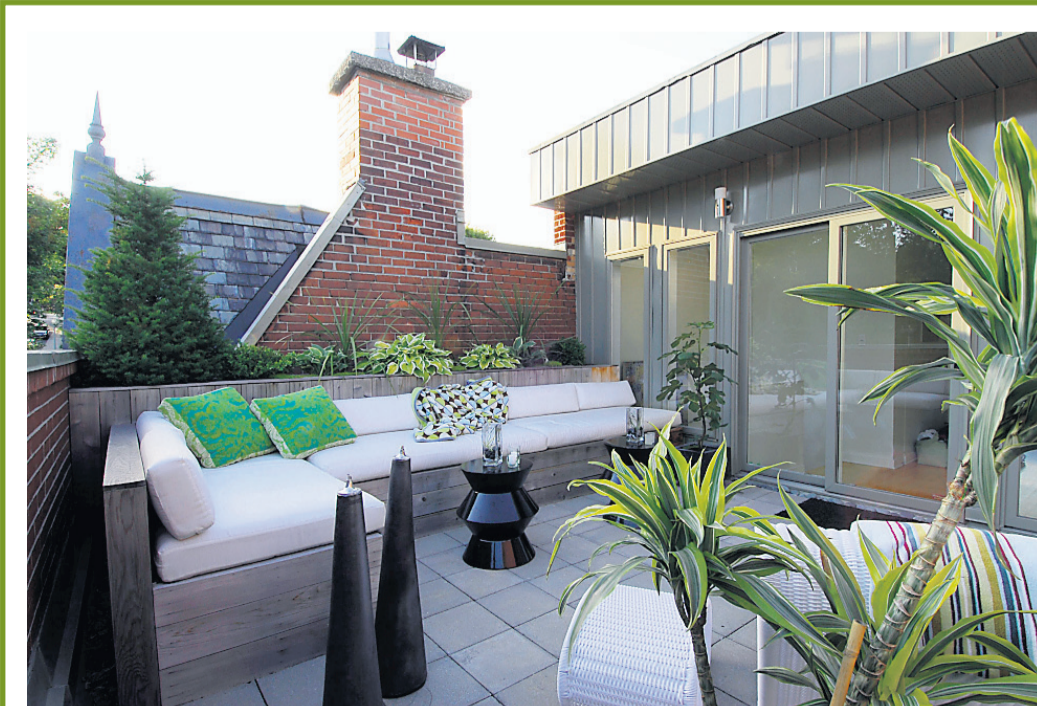
Daccord Webster Paysage, de Montréal, a reçu le prix Coup de cœur ex aequo pour le projet de toit-terrasse L'Oasis.