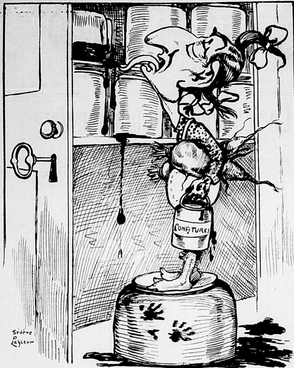
MÉDERIC.—Ah! les bonnes confitures... et dire qu'on voudrait me les enlever... quand j'en ai pour moi et pour toute ma famille.

Note de la Rédaction.—Nous republions, à la demande de nos lecteurs, cette vignette qui est tant d'actualité.