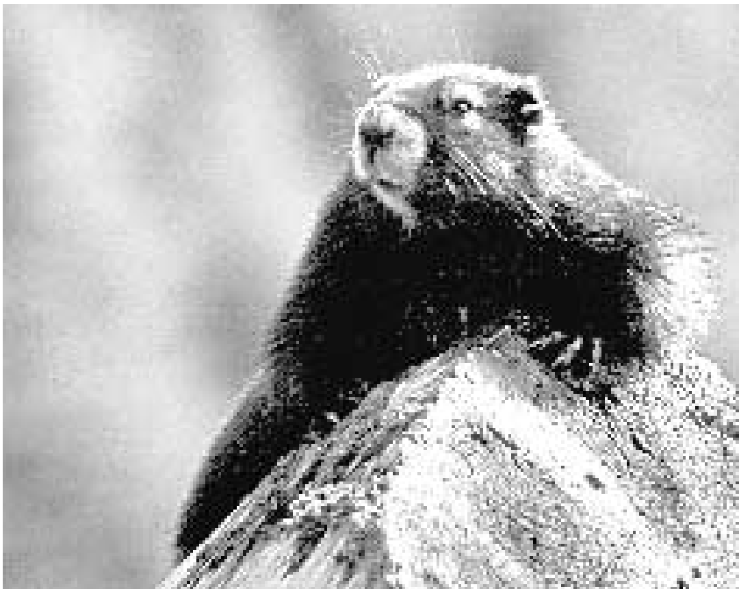
La Marmota vancouverensis ou marmotte de Vancouver.