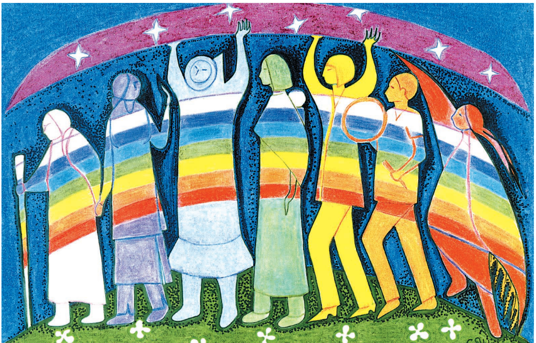
Illustration CHRISTINE SIOUI WAWANOLOATH