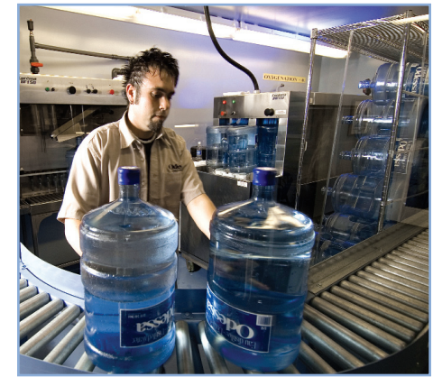
L'usine d'embouteillage d'eau distillée de Club d'Eau Plus.