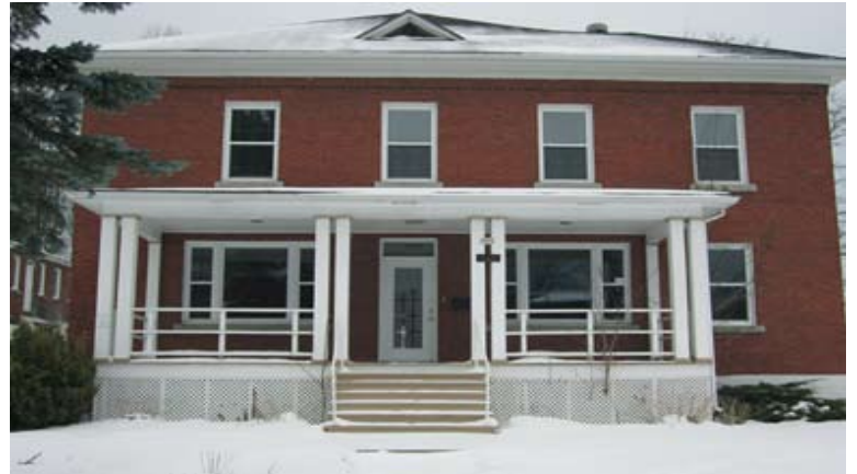
La nouvelle maison des grands-parents

Une vraie maison ayant pignon sur rue principale, en face de l'école des Quatre-Vents son premier lieu d'intervention il y a quinze ans, à côté des Habitations Mont-Bellevue (église St-Joseph réaménagée)... entourée de partenaires et de voisins exceptionnels... Wow !!! Un avenir prometteur.