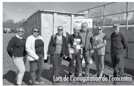
Lors de l'inauguration de l'écocentre

www.mrcdecoaticook.qc.ca/services/matieres-residuelles-ecocentres.php