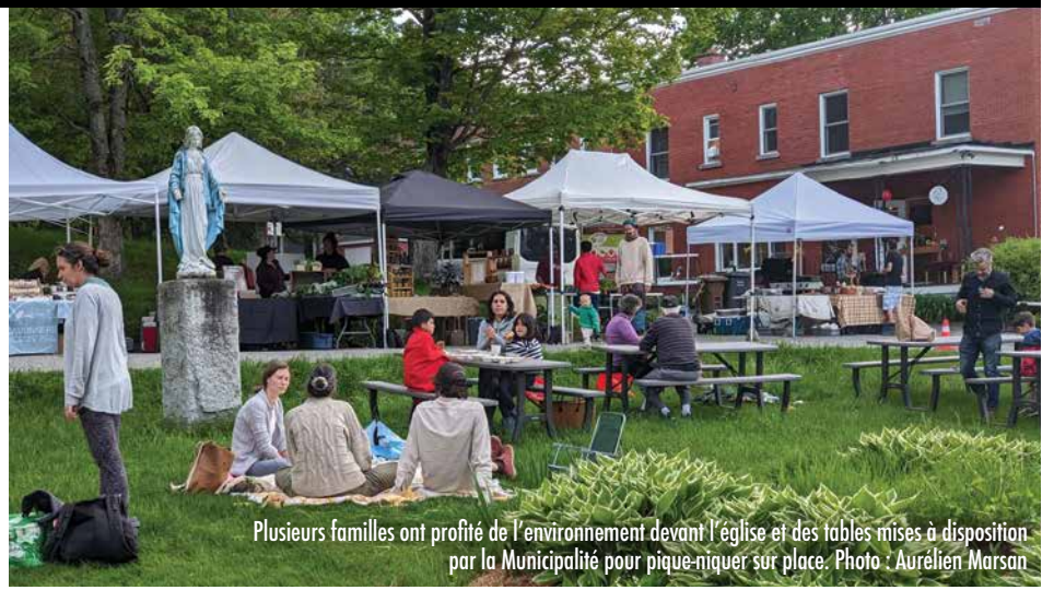
Plusieurs familles ont profité de l'environnement devant l'église et des tables mises à disposition par la Municipalité pour pique-niquer sur place.

Des légumes locaux, bien sûr, mais aussi du miel, des produits de l'érable, du prêt-à-manger et d'autres produits d'artisanat sont offerts. Le conseil d'administration de l'OBNL travaille entre autres activement à se doter des moyens d'offrir des activités et animations à l'attention de la clientèle familiale qui fréquente le marché tout l'été. Plusieurs subventions ont d'ailleurs été obtenues par le marché public à ce propos.