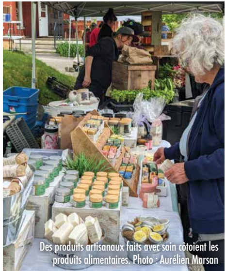
Des produits artisanaux faits avec soin côtoient les produits alimentaires.

LE VENDREDI 24 MAI A MARQUÉ LA RÉOUVERTURE DE LA SAISON DU MARCHÉ PUBLIC DE WATERVILLE. UN RENDEZ-VOUS HEBDOMADAIRE OÙ LES CITOYENS PEUVENT ALLER S'APPROVISIONNER EN PRODUITS LOCAUX TOUT EN RENCONTRANT DIRECTEMENT LES PRODUCTEURS. ET CE, EN PLUS DE PROFITER D'ANIMATIONS DONT L'OBJECTIF EST DE FAVORISER LES ÉCHANGES ET LE REGROUPEMENT AU SEIN DE LA COMMUNAUTÉ.