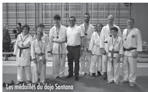
Les médaillés du dojo Santana